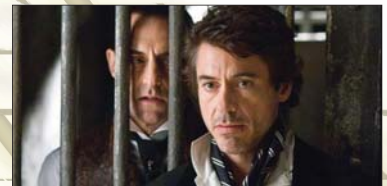
5- (Sherlock Holmes) ۹.۸۸۰ ملیۆن $، كۆى داھات: ۱۸۰.۰۷۳ ملیۆن $، بە ۴ ھەفتە، پلەى پىشوو: ۲.