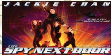
6- (The Spy Next Door) ۹.۶۰۰ ملیۆن $، كۆى داھات: ۹.۶۰۰ ملیۆن $، بەیدك ھەفتە.