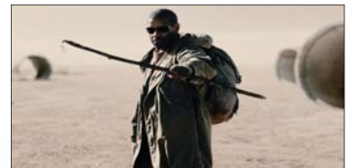
2- (The Book of Eli) ۳۲.۷۷۰ ملیۆن $، كۆى داھات: ۳۲.۷۷۰ ملیۆن $، بەیدك ھەفتە.