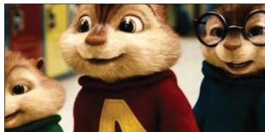
4- (Alvin and the Chipmunks: The Squeakquel) ۱۱.۶۵۰ ملیۆن $، كۆى داھات: ۱۹۲.۷۴۲ ملیۆن $، بە ۴ ھەفتە، پلەى پىشوو: ۳.

فىلمەكە بەناوى "پەرتوكى ئیلی" یە ئەم پەرتوكەش كە ناوى فىلمەكەى لىنراوھ كۆبیبەكى "پەرتوكى پیرۆز"، كەبەرتیبە لە پەيامەكانى خوا لە ئىنجیل و تەوراتدا، كە مەسیحیەكان پەپرەوى دەكەن. ناشكراپە ئەم پەرتوكى پیرۆز "الكتاب المقدس" بەپى گنراوھى قوتابیبەكانى مەسیح (د.خ) جیاوازی لەنێوانیاندا ھەبە. ئەم فىلمە باس لە پیاویك دەكات ناوى "ئیلی" یە، كۆبیبەكى لە پەرتوكى پیرۆز دەستكەوتووھ كە وەك لە فىلمەكەدا ناماژەى پیدەكات تاوھكو ئىستا كەس ئەو كۆبیبەى نەیبینوھ، لەو كۆبیبەى ئیلی چەندین نەپتى پاشەرۆزى زەوى تیدایە، كە مەسیح باسى لىوھە کردووھ، بۆیە ئیلی رینگە دەگرتە بەر بۇ ئەوھى