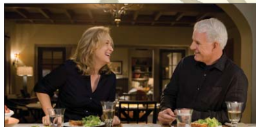
7- (It's Complicated) ۷.۶۷۲ ملیۆن $، كۆى داھات: ۸۸.۲۲۴ ملیۆن $، بە ۴ ھەفتە، پلەى پىشوو: ۵.