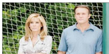
9- (The Blind Side) ۵.۵۵۵ ملیۆن $، كۆى داھات: ۲۲۶.۷۶۴ ملیۆن $، بە ۹ ھەفتە، پلەى پىشوو: ۷.