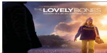
3- (The Lovely Bones) ۱۷.۰۲۰ ملیۆن $، كۆى داھات: ۱۷.۴۸۷ ملیۆن $، بە ۶ ھەفتە، پىشوو: ۱.