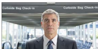
10- (Up in the Air) ۵.۴۵۸ ملیۆن $، كۆى داھات: ۶۲.۸۳۱ ملیۆن $، بە ۷ ھەفتە، پلەى پىشوو: ۸.