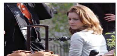
8- (Leap Year) ۵.۸۲۸ ملیۆن $، كۆى داھات: ۱۷.۵۲۹ ملیۆن $، بە ۲ ھەفتە، پلەى پىشوو: ۶.

باشترین ۱۰ فىلمى ئەم ھەفتەیبە ھەمان فىلمەكانى ھەفتەى پىشوو