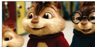
3- Alvin and the Chipmunks: The Squeakquel (۱۶.۳۰۰) مىليۇن $، كۆى داھات: ۱۷۸.۱۸۴ مىليۇن $، بە ۳ ھەفتە، پەلەى پىشوو: ۳.