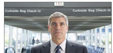
8- Up in the Air (۷.۱۰۰) مىليۇن $، كۆى داھات: ۵۴.۷۰۰ مىليۇن $، بە ۶ ھەفتە، پەلەى پىشوو: ۶.