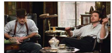
2- Sherlock Holmes (۱۶.۶۱۰) مىليۇن $، كۆى داھات: ۱۶۵.۱۷۸ مىليۇن $، بە ۳ ھەفتە، پەلەى پىشوو: ۲.