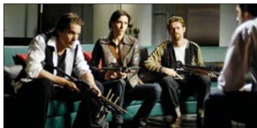
4- Daybreakers (۱۵.۰۰۰) مىليۇن $، كۆى داھات: ۱۵.۰۰۰ مىليۇن $، بە ۳ ھەفتە.

باشترىن ۱۰ فىلمى ئەم ھەفتەىە ھەمان فىلمەكانى ھەفتەى پىشوو