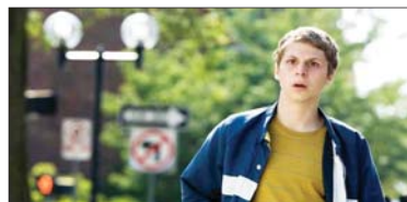
9- Youth in Revolt (۷.۰۰۰) مىليۇن $، كۆى داھات: ۷.۰۰۰ مىليۇن $، بە ۳ ھەفتە، پەلەى پىشوو: ۶.