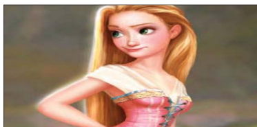
10- The Princess and the Frog (۴.۷۰۰) مىليۇن $، كۆى داھات: ۹۲.۶۰۰ مىليۇن $، بە ۷ ھەفتە، پەلەى پىشوو: ۷.