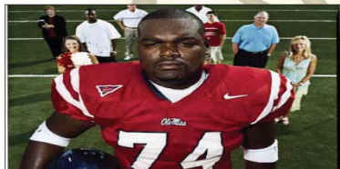
7- The Blind Side (۷.۷۵۰) مىليۇن $، كۆى داھات: ۲۱۹.۱۹۷ مىليۇن $، بە ۸ ھەفتە، پەلەى پىشوو: ۵.