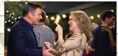
5- It's Complicated (۱۱.۰۰۷) مىليۇن $، كۆى داھات: ۷۶.۳۷۰ مىليۇن $، بە ۳ ھەفتە، پەلەى پىشوو: ۴.