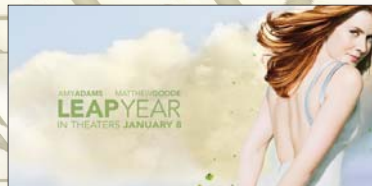
6- Leap Year (۹.۱۶۵) مىليۇن $، كۆى داھات: ۹.۱۶۵ مىليۇن $، بە ۳ ھەفتە، پەلەى پىشوو: ۴.