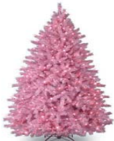
سانی نونان پیروز بیت