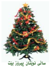
سانی نوینان پیروز بیت

كه چی ته گهر سهیریکی ئه و کیسه له بکه ین، به کیسه لێکی سهیری و گه وه دێته بهرچاو، ئه مهش كاتیك له لێواری ویلاهیته هاواری له ئه مه ریکا دۆزراوه ته وه. سهیری ئه و کیسه له له شیوه گه وه كه یه تی، كیشی کیسه له كه نزیكه ی (۱۲۰) کیلوگرام بوو، ئه مهش كاتیك له سه ره نامیزی كیشان دانرا.