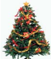
ساتى نویشان پیروز بیت