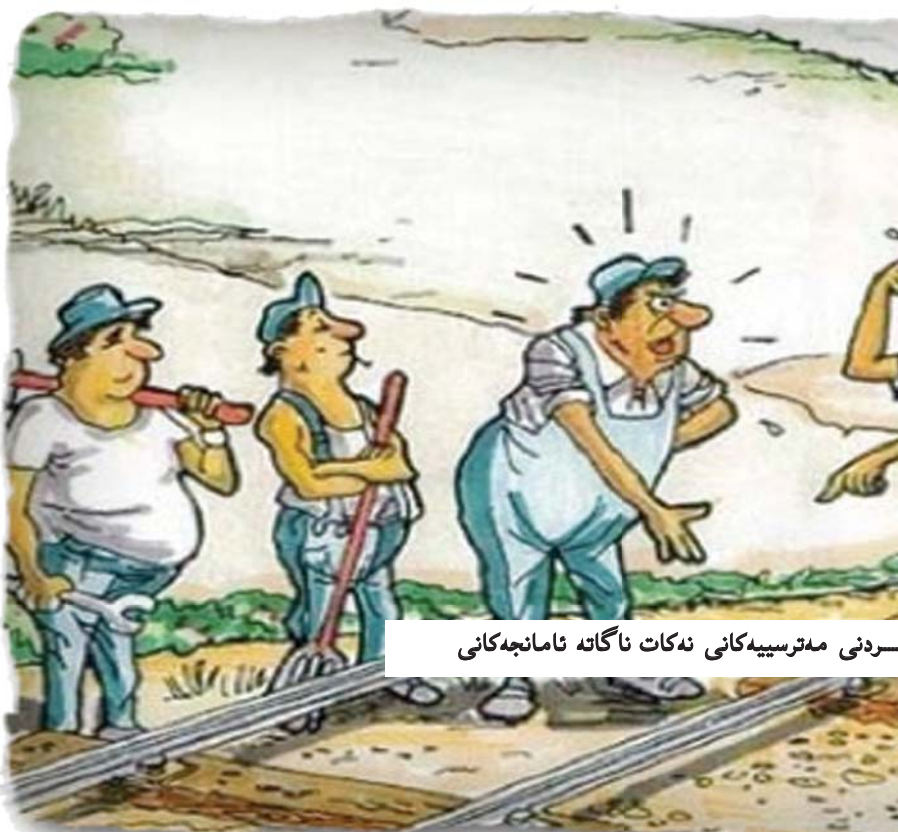
سروشتى مەترسییەكانى نەكات ناگاتە ئامانجەكانى

بەرپۆبەردنى كۆمپانیایەكان بۆ ئەگەرى سەرکەوتن زیاد دەكات و، دەبیٲتە هۆى كەمكردنەوى ئەگەرەكانى