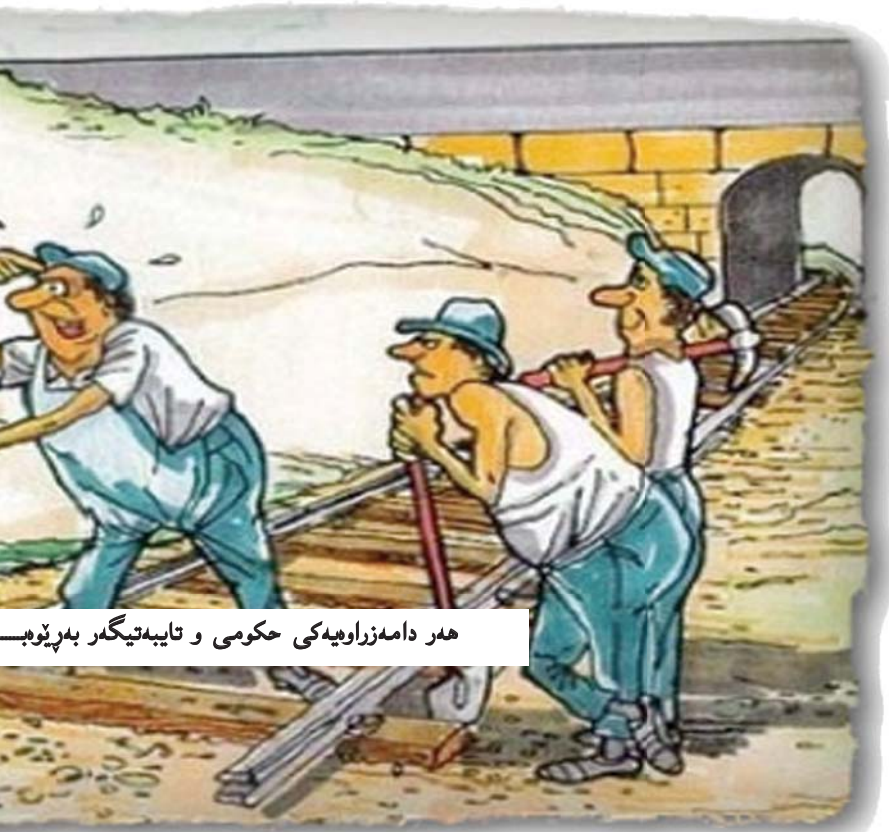
ھەر دامەزراوہيەكى حكومى و تايبەتەيەگر بەرپۆبەردنى