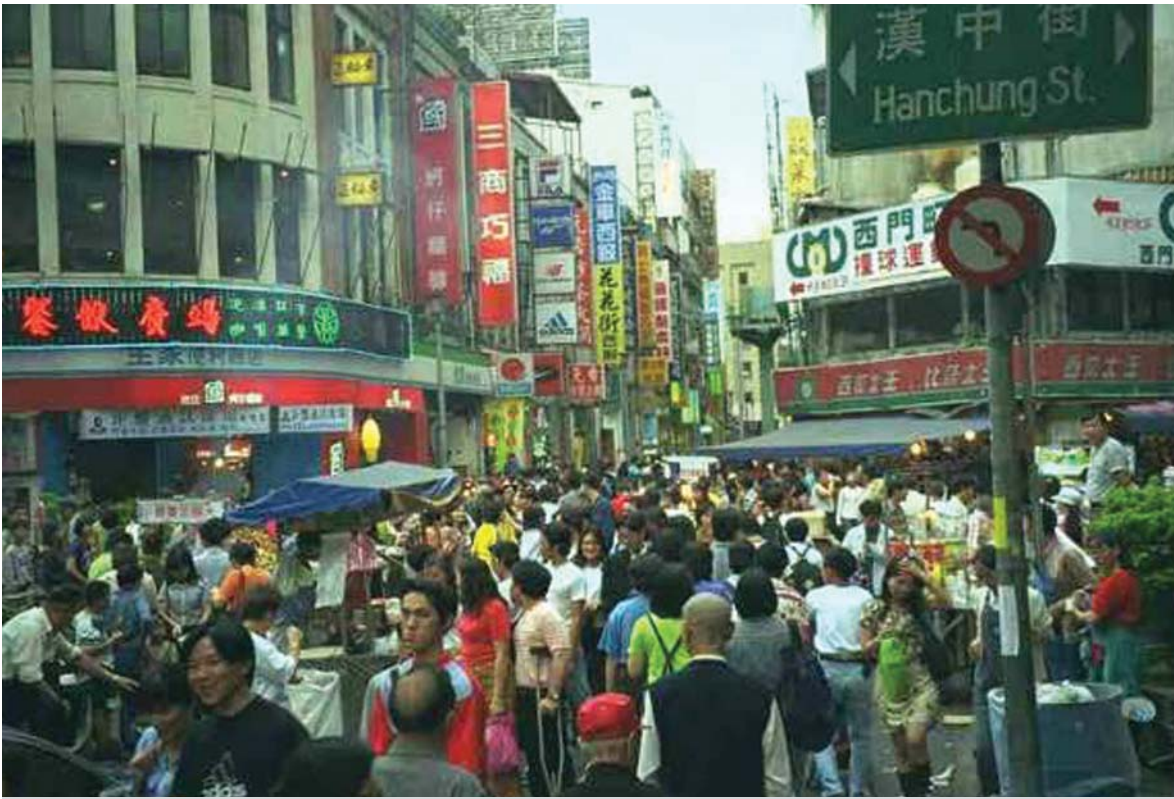
تايوان پيش چين كوت له پاراستنى مافى مۆلكدارىتى تاكه كەسى

كشتوكالى لىم زەبىيانەۋە بەرھەم دەھات. بۆيە دوركەوتنەۋە لەمۆلكدارى دەۋلەت فراوانكردنى مۆلكدارىتى تايبەتى دەرتەنجامى سەرسوپھىنەرى دەيت. خالىكى تر كە زۆر گرنگە واىكردوۋە مۆلكدارىتى تايبەتى جىبى تىپرانىن بىت ئەو كەسانەى مۆلكدارىتى تايبەتتىيان ھەبە زياتر پەرەپىدان بەتواناكانيان دەدەن، بۆنمونسە كاتىك گۇفارىك ياخود رۇژنامەبەكى تايبەتى ھەبىت و نووسەرو رۇژنامەنووسەكان پشكىان تىدا ھەبىت و ايان لىدەكات زياتر راپۇرت و رىپۇرتاژى بەھىز بىلاۋىكەنەۋە بۇ ئەۋەى تىراژى مېدىياكەيان بۇ پىشەۋە بىەن لەرېنگاى رايكىشانى زۆرتىن خويئەن، چونكە ھاندەرى قازانچ و بەرزبونەۋەى بەھاي گۇفارەكەيان زىاد دەبىت و قازانچى زياتر دەكەن، ھەرئەمەش جىاۋازى نىۋان خويلىكى راھىنان و مەشقى حكومىبە لەگەل ھەمان خول بەشۋەى تايبەتى كە وا لە قوتابىبەكە دەكات زياتر بخويئەن، چونكە لە دوۋەمدا قوتابىبەكە پارەى داۋە مافى مۆلكدارىتى ھەبە بەواتايەكى تر مۆلكدارىتى تايبەتى سوۋدى بۇ بەرزكردنەۋەى بەھرە تۈواناكانى كەسانى تىش ھەبە..