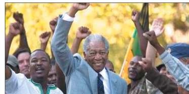
3- (Invictus) ۸،۶۱۱ مىليۇن$. كۆى داھات: ۸،۶۱۱ مىليۇن$. بە ۱ ھەفتە.