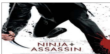
10- (Ninja Assassin) ۲،۷۰۷ مىليۇن$. كۆى داھات: ۳۴،۳۰۴ مىليۇن$. بە ۲ ھەفتە، پەلى پىشۋ: ۸.