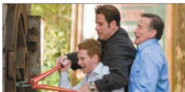
7- (Old Dogs) ۴،۴۰۹ مىليۇن$. كۆى داھات: ۳۹،۹۹۶ مىليۇن$. بە ۳ ھەفتە، پەلى پىشۋ: ۵.