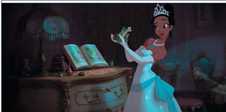
1- (The Princess and the Frog) ۲۴،۲۰۸ مىليۇن$. كۆى داھات: ۲۷،۰۸۸ مىليۇن$. بە ۳ ھەفتە، پەلى پىشۋ: ۱۶.

زۇرجار بەرھەم ھېنەرەكانى فىلىم لە ئەمەرىكا و جېھان پەنا دەبەنە بەر رۇمان، ئەمەش بەھوى ئەو چىژە ئەدەبى و ھونەرىيەكە لەرۇماندا بەدى دەكرىت، و زۇرجار پالەوانانى رۇمانەكە كەسايەتتى پرتوانا و داستاناوين كە دوورە لە راستىيەو، بەم جۇرە فىلىمانەش دەوترىت رۇمانە فىلىم. لەسەرەتاي دروستىونى "ھۆليۇد"و ئەم جۇرە فىلمە ناويانگى ھەيە.