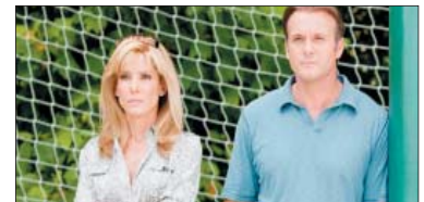
2- (The Blind Side) ۱۵،۰۵۵ مىليۇن$. كۆى داھات: ۱۴۹،۸۱۶ مىليۇن$. بە ۴ ھەفتە، پەلى پىشۋ: ۱.