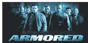
9- (Armored) ۳،۵۰۴ مىليۇن$. كۆى داھات: ۱۱،۷۵۰ مىليۇن$. بە ۲ ھەفتە، پەلى پىشۋ: ۸.