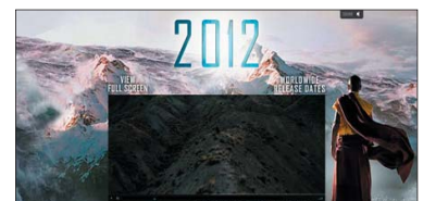
8- (2012) ۴،۳۵۱ مىليۇن$. كۆى داھات: ۱۵۵،۲۸۸ مىليۇن$. بە ۵ ھەفتە، پەلى پىشۋ: ۷.