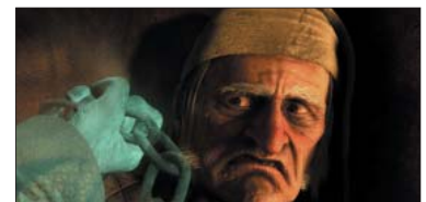
5- (Disney's A Christmas Carol) ۶،۸۳۳ مىليۇن$. كۆى داھات: ۱۲۴،۴۲۶ مىليۇن$. بە ۶ ھەفتە، پەلى پىشۋ: ۴.