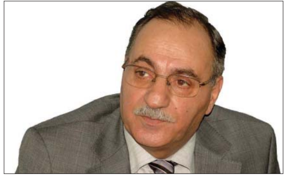
سامی شورش تاییه‌ت بو گولان ددینوسی

دوره‌ی بهیږنږت و ریښه له وه بگریږت ئیتر واشنتون به ره‌بابی، خوی بو شه‌ری ده‌وله‌تیکی دیکه‌ی وه‌کو ئیران له هه‌مان ناوچه‌دا ئاماده بکات. له وه به‌ولاتر، تاران خه‌ریکی تاوپیډانی به‌رنامه عه‌سکه‌ریه‌کانی خویته‌ی به تاییه‌تی له بواری به‌ره‌مه‌ینانی مووشه‌کی دووربور دو پالیستی. به‌م دواییه، تاران رایگه‌یاند که خه‌ریکی تاقی کردنه‌وه‌ی مووشه‌کیه‌ مه‌وداکه‌ی پتر له دوو هه‌زار کیلومه‌تره. ئه‌مه‌شی بو ئه‌وه‌یه له دواړوژیکي نزيکدا بتوانیت مه‌ودای مووشه‌که‌کانی بگه‌یه‌یتته سځ هه‌زار کیلومه‌تر، هه‌تا بتوانیت بیانگه‌یه‌یتته ئه‌وروپای ناوهر‌است. بیجگه له به‌رنامه‌ی مووشه‌کی، تاران به گه‌رمی خه‌ریکی په‌رپیډانی به‌رنامه ئه‌تو‌مییه‌که‌یه‌تی. له‌م چهند مانگه‌ی رابردوودا، ئاشکرای کرد که خه‌ریکی دانانی بنکه‌یه‌کی ئه‌تو‌مییه له شویتیکي نه‌ینی نزيك شاری قوم. ئینجا رایشگه‌یاند که بو ئه‌وه‌ی توانسته ئه‌تو‌مییه‌که‌ی خوی بگه‌یه‌یتته راده‌یه‌کی باش، پیوستی به دامه‌زاندنی ۱۵ بنکه‌ی دیکه‌ی ئه‌تو‌مییه هیه‌یه بو بیتاندنی یورانپوم. نه‌ک هه‌ر ئه‌وه‌نده، بگره له‌سه‌ر ئاستی ناوه‌خو‌شدا، ئیران له هه‌لبژاردنی رابردووه‌وه، به گه‌رمی که‌وتو‌ته ویزه‌ی ته‌ورمه‌کانی چاکسازی و ئوپوزیسیون و به‌وپه‌ری توندوتیژی سه‌رکوتی خو‌یشاندانه‌کانیان ده‌کات. مه‌به‌ست له‌م سه‌رکوتکردنه‌ش، زامنکردنی بارودوخیکي ناوخوی هیمن و سه‌قامگیره له پیناو به هیزکردنی پینگه‌ی خوی له بواری رووبه‌روبوونه‌وه‌ی سه‌ربازی له‌هه‌ر حاله‌تیکدا ئه‌گه‌ر ناکوکیه‌کانی له‌گه‌ل ئه‌مه‌ریکا گه‌یشتنه راده‌ی ته‌قینه‌وه. له‌وانه‌ش به‌ولاتر، تاران