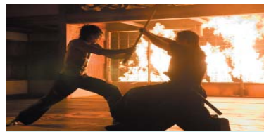
6. Ninja Assassin) ۱۳،۱۳۵ ميليۆن $، كۆى داھات: ۱۳،۱۳۵ ميليۆن $، بە بەك ھەفتە