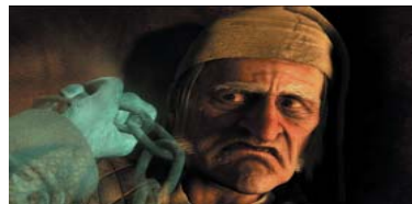
5. Disney's A Christmas Carol) ۱۶،۰۰۳ ميليۆن $، كۆى داھات: ۱۰۵،۳۷۳ ميليۆن $، بە ۴ ھەفتە، پلەى پيشوو: ۵.