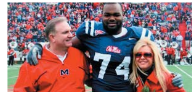
2. The Blind Side) ۴۰،۱۲۵ ميليۆن $، كۆى داھات: ۱۰۰،۲۵۰ ميليۆن $، بە ۲ ھەفتە، پلەى پيشوو: ۲.