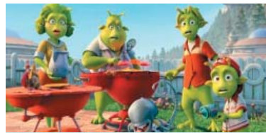
7. Planet ۵۱) ۱۰،۲۰۰ ميليۆن $، كۆى داھات: ۱۰،۲۰۰ ميليۆن $، بە ۲ ھەفتە، پلەى پيشوو: ۴.