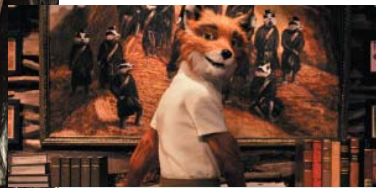
9. Fantastic Mr. Fox) ۷،۰۲۰ ميليۆن $، كۆى داھات: ۱۰،۱۰۸ ميليۆن $، بە ۳ ھەفتە، پلەى پيشوو: ۴.