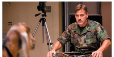
10. The Men Who Stare at Goats) ۱،۵۳۳ ميليۆن $، كۆى داھات: ۳۰،۵۵۲ ميليۆن $، بە ۴ ھەفتە، پلەى پيشوو: ۷.