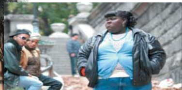
8. Precious) ۷،۰۹۰ ميليۆن $، كۆى داھات: ۳۲،۴۶۱ ميليۆن $، بە ۴ ھەفتە پلەى پيشوو: ۶.