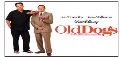
4. Old Dogs) ۱۶،۸۴۶ ميليۆن $، كۆى داھات: ۱۶،۸۴۶ ميليۆن $، بە بەك ھەفتە.