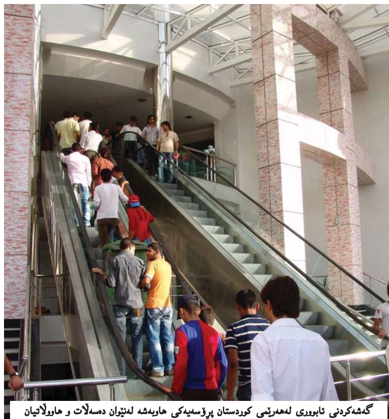
گه شه كرده ی ئابووری له مه رتی كورده ستان پرۆسه یه كی هاو به شه له تیان ده سه لات و هاوولاتیان