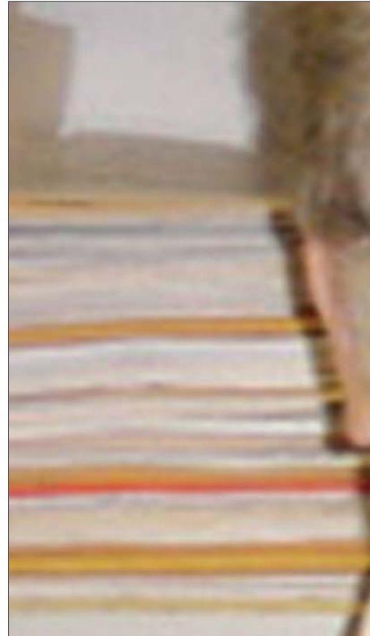
پرسیکی نیوده ولته تی، بۆ نمونه ریگ خراوی چاودی ری مافه کانی مرؤف و گروپی قهیرانی نیوده ولته تی که گریڈراوی چهند بهر ژوهندی کی دیاریکراون له ئه وروپا و

پرو فیسور نولسن پیی راگه یان دین، به داخه وه ریگ خراوی کی وه ریگ خراوی HRW گریڈراوی هندیك بهر ژوهندی تاییه تین و دزی نته وهیه کی مدز لومی وه نته وهی کورد بهو جوره دهنوسن، نهمهش دهقی هه فیه یینه که ی پرو فیسور روبرت نولسنه تاییهت به گولان.