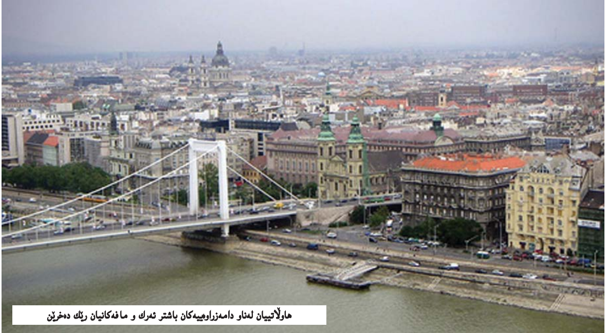
ھاولاتیپان لەنار دامەزراویھەکان باشتەرک و مافەکانیان رێک دەشێن

کیشەکەى ئەو کۆمەلگایانەى وەکو ھەریمی کوردستانن و دەیانەویت ھەنگاوەکان بەرەو بنياتنانی حکومەتى دامەزراوەیى بنین، ئەوھە یاسا لەخزمەتى تاک دا نییە