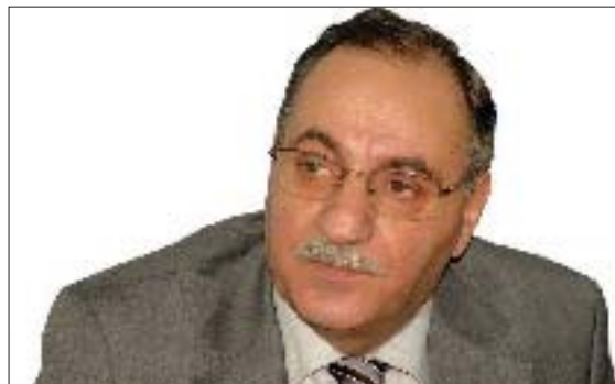
سامى شۇرش تايبەت بۇ گولان دەينوسى

ئەۋ ناخەزو دوژمنانە، دەبانەۋىت بلىن بارودۇخى كەركوك زادەى