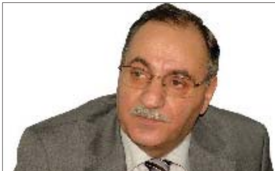
سامى شۇرش تايىبەت بۇ گولان دەينووسى

بانگەھىشتەكى سەرۇك ئۇباما بوو بۇ دايەلۇگ لەگەل ئىران و كشاندەوەى ھىزەكانى ۋلاتەكەى لە عىراق. دوو، ناكۆكىەكانى نىوان ئىران و ئەمىرىكا، لەو ماوئەدا، بە تايىبەتى دواى ۱۱ سىپتەمبەرى ۲۰۱۱، بە شىۋەيەكى زۇر ترسناك پەردە سەند بە تايىبەتى لەبواری بەرنامە ئەتۆمىەكانى تاران. لەو ھەوتىر ترسناكىەكە زۇر زۇرتىر بوو لە بواری عىراق و لوبنان. ئىنجا ئىرانىش لە بارى خۇيەو، لەو ماوئەدا، بە پىي قسەى ئەمىرىكىەكان، دەستى كرو بە پەپرەكردى سىياسەتى ھاوكارى و يارمەتى دانى رىكخراوى ئەلقاعىدە تىرۇرىست. ديارە مەبەستى ئىران لەو سىياسەتە راگرتى لەنگەرى ناكۆكىەكانى خۇى بوو لەگەل ئەمىرىكا. ئەم سىياسەتە وى كرو ئىرانىەكان يارمەتەكى نەئىبى زۇر پىشكەش بە تىرۇرىستانى ئەفغانىستان بگەر. بگرە ھەندىك ناۋەندى ئەمىرىكى پىيان وايە تاران لە ھەماھەنگىەكى نەخشە بۇ كىشراو دايە لەگەل ئەلقاعىدە. سىيەم، ئالۇزىە ناوخۇيەكانى پاكىستان، بە تايىبەتى لەسەر ئاستى سىياسى و نابورى و پەيوئەدىە ناوچەيىەكانى ئەو ۋلاتە، تا دەھات ئالۇزىتر دەبوون بەتايىبەتى دواى دەست لە كار كىشانەوەى ژەنەرال پەروىز موشەرەف. پاكىستان، ئىستا بە ھۇى ئالۇزىيەكانى ناوچە سنورىيەكانى ھاوبەشى لەگەل ئەفغانىستان دووچارى بارودۇخىكى ئالۇزىكاۋى ناوخۇيى گەرە ھاتوۋە. چوارەم، ئالۇزىبونى بارودۇخى ئەمنى و سىياسى لە عىراق و ھاتنە پىشەوەى دەنگۇى گىتوگۇى سىياسى لەگەل ھەندىك لە رىكخراۋەكانى تىرۇرىستان. ھەك مەعلومە عىراق ماوەى شەش سالىە لە بارىكى ئەمنى و سىياسى زۇر خراپ