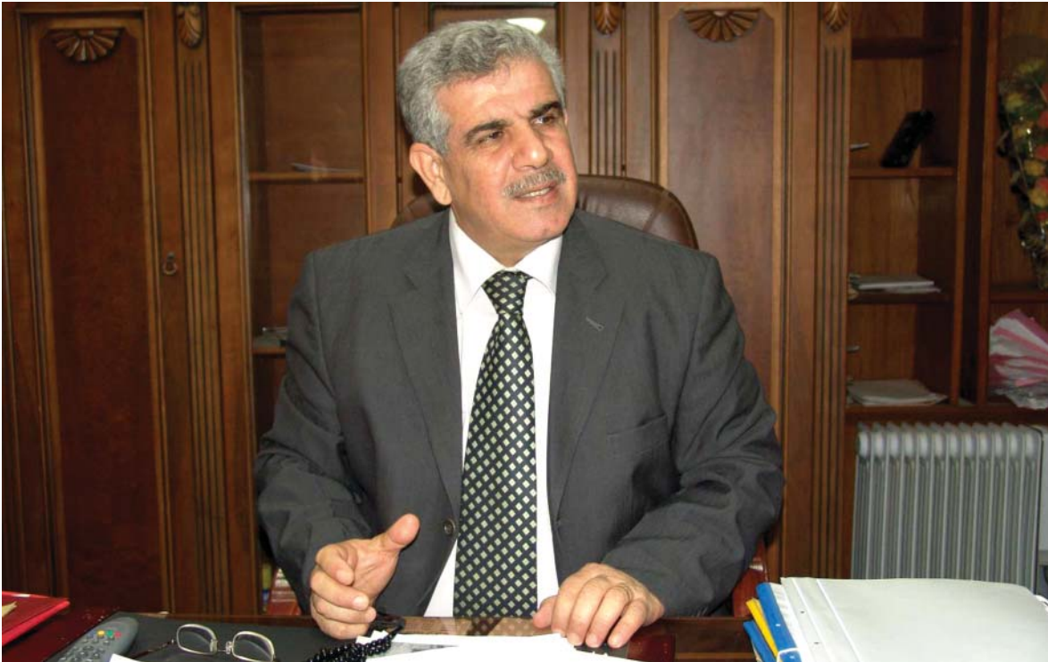
عه عبدالله رحمان مسته فا پاريزگاري كهر كوك بؤ گولان:

پاريزگاي كمرڪوك به دريژاي ميژوي عيلاق هوكاري ناسه قامگيري عيلاق بووه، هه موو كيشه و ناكوكيه كاني عيلاق و هه موو شؤر شه كاني كورده له پيښاوي كمرڪوك هه لگيرساون هه له پيښاوي كمرڪوك دامر كاوندتوه له هه موويان گرنگتر شؤرشي مهزني نيلوول، بؤيه چؤن مانهوي چاره سهه كورنې كيشه ي هوكاريكه بؤ ناسه قامگيري هه موو عيلاق، چاره سهه كورنېشي هوكاريكه بؤ سهه قامگيري هه تا هه تايه ي عيلاق، خه لكي كمرڪوك ته گرهه دستي دهره كي وازيان له بهيښخ تامادن له چوار چيره ي هه رتي كورده ستان پيښهوه بؤين،