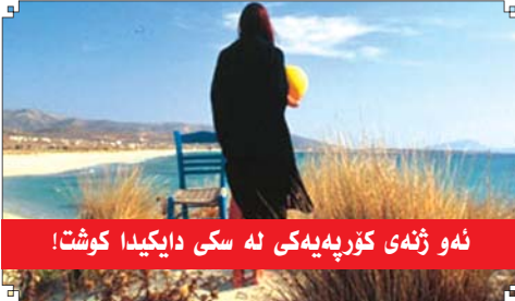
ئەو ژنەى كۆرپەبەكى لە سكى داىكىدا كوشت!