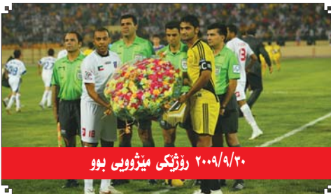
۲۰۰۹/۹/۲۰ رۆژىكى مېژووى بوو