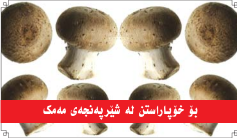
بۆ خۇپاراستن لە شىرپەنجەى مەمەك

■ ناوونىشان: ھەولێر - شەقامى ۴۰ مەترى تەنیشەت مەكتەبى نارەندى راگەيانندى (پ.د.ك)