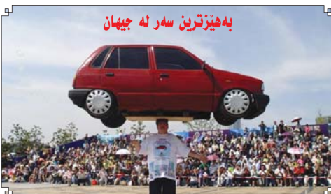
بەھىزترین سەر لە جىهان