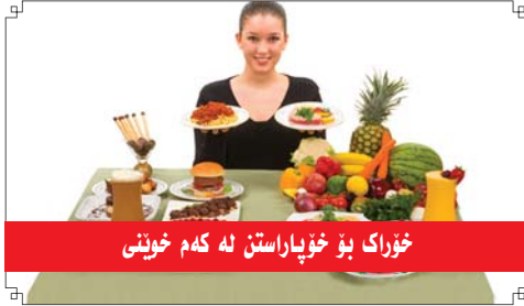
خۇراك بۇ خۆپاراستن لە كەم خونى