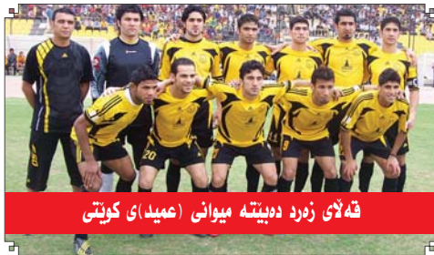
قەلای زەرد دەپىتە مېۋانى (عمىداى كورپتى