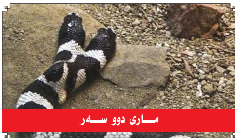
ماری دوو سەر