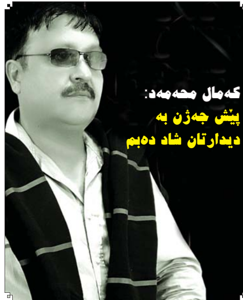
که مال محمه د: پیش جه ژن به دیدارتان شاد دهیم

■ جیگری سه رنووسه ر فهرهاد محمه د Deputy Editor-in-Chief Farhad M.hassn frhd_mhmd@yahoo.co.uk Farhadmohmad@gulan_media.com تله فون: ۲۲۳۱۵۲۷