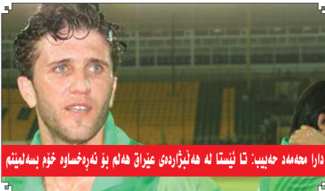
دارا محمه د جه ییب: تا نیستا نه هه لیزاردی عیراق هه لم بؤ نه رده خواوه خوم بسله یینم