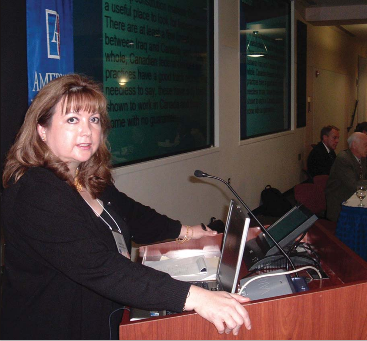
پروفیسور کارول ٹویتری بھریو بہری پروگرامہ کانی سہنتہری ناشتی بؤ جیہان بؤ گولان: