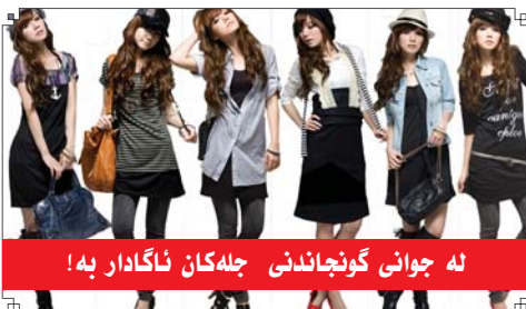
نه جوانی گونچاندى جله کان ناگدار به!