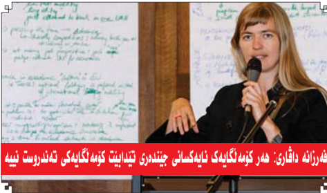
فهرزانه دافاری: هر کومه لگه یه کانی نایه کسانى چنډه رى تیدابنت کومه لگه یه کانی ته ندروست نیسه

■ سه رنووسه ر فوناد سديق Editor-in-Chief Fuad Sideeq fuadsdeeq@hotmail.com ۰۶۶ ۲۲۳۲۸۵ ۰۶۶۲۲۳۰۳۰۰