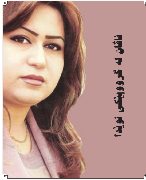
ناغان به گروویکی نویدا