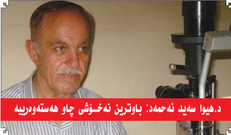
د. هیوا سید نه حمده د: باوترین نه خوشی چاو هه سته وه ریه

■ ناوونیشان: هه ولیز - شه قامى ۴۰ مه تری ته نیشته مکه ته یى ناوه ندى راگه یاندى (پ.د.ک)