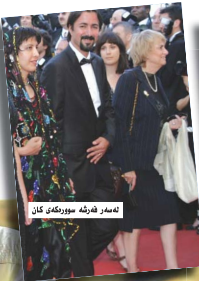
لەسەر فەرشە سوورەكەى كان

- ئەو ھەلومەرجەى كە ئىمە ئەو فىلمەمان تىدا بەرھەمەيتنا زۆر ماندوو و ھىلاكى كردين و بەرپۆز وەزىرى رۆشنىرىش بە تەواوى پشستىگرى كردين لە ھەموو روويەكەوہ، ئەگەر ئەو بىروكراتىيەى ئىستا ھەيە نەمىنىت ئەوا سىنارىؤيەكى كوردى باشم داناوہ، ھىوادارم بتوانم كارىكى ھونەرى زۆر بەرز پىشكەش بگەين، دەمەوى ئەو بلىم كە كارىكى گەورە بەرپۆيە، دواى ئەوہى لەسەررەوبەندى چالاكىيەكانى فىستىقالى (كان) ھەندىك لە گەورە سىنەماكاران و ئەوانەى لە بوارى سىنەما كار دەكەن يەكترمان ناسى و خۇشحالى خۇى بۇ ئەو فىلمە دەرىپرى، پرپارىيان داوہ ھاوكاريمان بگەن بە گۆرەى توانايان ئىمەش ھەول دەدەين سوود لە شارەزايى ئەوان وەرېگرين، بىرۆكەى فىلمەكە ئەوہى كە چۆن بتوانين ئەو كيانەى كوردىيەى ئىستا لە رووى ئۆنەتەوہىيەوہ بىپارىژن و رووى گەشى كورد و كوردستان نىشانى جىھان بدەين بەتايبەتى كە كورد باوہشى كرذۆتەوہ بۇ ھەموو نەتەوہكانى دىكەى سەر ئەم زەمىنە، ئىمە دەمانەوى ئەوہ لە رىنگاى فىلمىك نىشان بدەين.