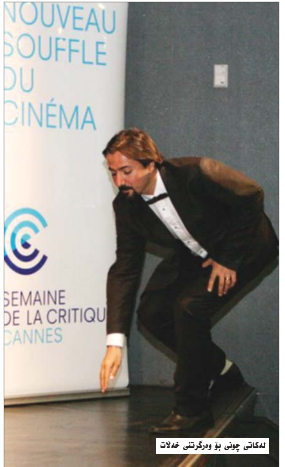
لەكاتى چوئى بۇ وەرگرتنى خەلات

* رۆلى كۆلاژ چى بوو لە فىلمەكەدا؟ - خۆى كۆلاژ لە دونىساي خولقاندنى پلاستىك و وئەكىشانەوہ ھاتو، من خۆم ھەولمدا پەنا بەرمە بەر كۆلاژ لەناو ناخى رووداوەكاندا واتە تۆ بتوانى لەبارەى ئاسۆيەوہ چەند وئەيەك رىز بىكەم كە