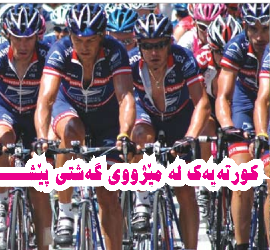
موحسىن عەزىز ئەحمەد راھىنەرى پايىسكلسوارى لە بەرىتانىا

ئەم پېشېر كىيە لە بەشى باشورى خاكى فەرەنسا و بەرشەلۇنەى ئىسپانىا دەپرت ئەوجا جارنىكى دى دەگەرپنەوہ بۇ نىو فەرەنسا بەرو سنوورى رۆژناوای سويسرا و ئىتالىا دەچىت