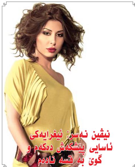
نیقین نه سر: ئیغرایه کی ئاسایی پینشگه ش ده کم و گوی به قسه ئادهم

■ فایله کان شه مال نووری: نابوری خه لیل به یی: هونه ری هاوژین عومه ر: کۆمه لایه تی مه هدی حاجی سالح: ره نگاره نگ د. عادل حوسین: ته ندروستی نه حمه د عه زیز: وه رزش ■ ناوونیشان: هه لیکر - شه قامی ۴۰ مه تری ته نیشته مه کته بی ناوهندی راگه یانندی (پ.د.ک.)