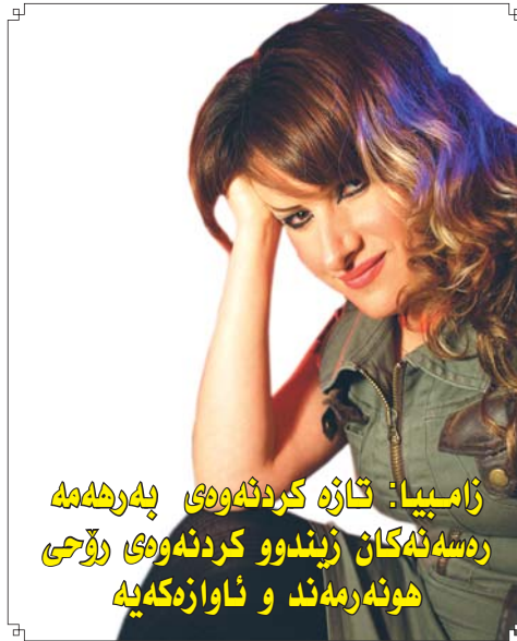
زامبیا: تازه کردنه وهی به ره مه ره سه نه گان زیندوو کردنه وهی رۆحی هونه ره مند و ئاوازه که یه

■ جیگری سه رنووسه فه ره هاد محهمه Deputy Editor-in-Chief Farhad M.hassn frhd_mhmd@yahoo.co.uk Farhadmohmad@gulan_media.com تله فون: ۲۲۳۱۵۲۷