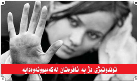
توندوتیژی دژ به ئافره تان له که مپوونه وه دایه

■ سه رنووسه فوناد سلیق Editor-in-Chief Fuad Sideeq fuadsdeeq@hotmail.com ۰۶۶ ۲۲۳۲۳۸۵ ۰۶۶۲۲۳۰۳۰۰