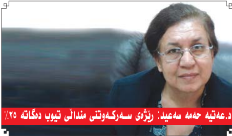
د. عه تییه جه مه سه عید: رژی سه ركه وتنى مندانی تیوب ده گاته ۲۵٪

■ به ریۆه به ری په یوه ندیه کان سالح عومه ر قادر Relation's Manager Mobil 0750 456 7070 salih_omer2003@yahoo.com