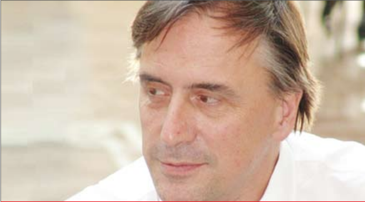
باليۇز پېتەر گالبريس بۇ گولان: