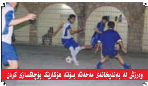
و ورزش له به ندیخانهای مهجه ته بیوته هؤکاریک بۆچاکسازی کردن