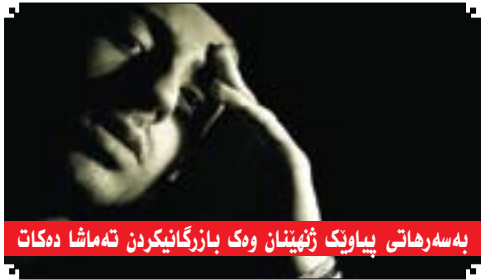
به سهرهاتی بیوانگ ژهنینان وهک بازرگانیکردن ته ماشا دهکات

■ سه ر نووسه ر فوناد سدیق Editor-in-Chief Fuad Sideeq fuadsdeeq@hotmail.com ۰۶۶ ۲۲۳۲۳۸۵ ۰۶۶۲۲۳۰۳۰۰