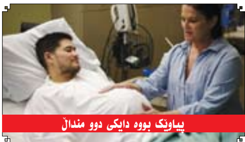
بیوانگ بووه دایکی دوو مندال