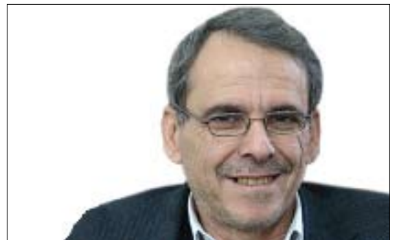
ناسۆ که ریم

راسته، هیشتا ئه و لیستانه، بهرنامه ی خۆیان بۆ داهاوو ئاشکرا نه کردوو و چۆن باس له کیشه و ناریشه سه ره کییه کانی ئه مرۆی کوردستان و ریگه چاره کان ده کهن، به لām له ناو خۆماندا هیله گشتیه کانی هه لایه نه ی له و لایه نانه دیار و خویان. هه روا هه مووشمان ئه وه ده زانین، هه لپژاردن به ته نه ی، پرۆسه یه کی (مجردی) ناوه کییه هه ریئی کوردستان نییه. به پله ی سه ره کی ئه مریکا، تورکیا و ئیران چاوه دپیری پرۆسه که و لایه نه به شداربووه کان و ئه نجامه کانی ده کهن. لایه نه کانی ناو عیراق-یش له (ده وه ی مالیکه یه وه بگره تا مه جلیسه ی ئه علا، مه جلیسه ی حیواری وه ته نه ی، حزبه ی ئیسلامیه ی، کیتله ی عه ره بییه ی موسه قیله و ره وتی صه در و جه ماعه ته ی ئوسامه نجیفی و به ره ی تورکمانی) به وردی سایه دییه بهرنامه، که سایه تیه ی لیسته کان و ئاخاوتن و بهرنامه ی سیاسیه کانیا ن و ئه نجامه کان ده کهن. ولاتانی دی، هه ره یه که یان له چاویلکه ی بهرژوه ندی و ئه وله ویا ته کانی له عیراق و ناوچه که، سه یری هه لپژاردنی ۷/۲۵ ی کوردستان ده کهن. لیژده دا، من ناچه سه ره ئه وه ی بهرژوه ندی هه ره یه که له و سه ی ولاته سه ری ناوم بردن، چ ده خوازی و چۆن ده جۆلینه وه. لئ به پر وای من، سه قامگیریه ی سیاسیه ی هه ریئی