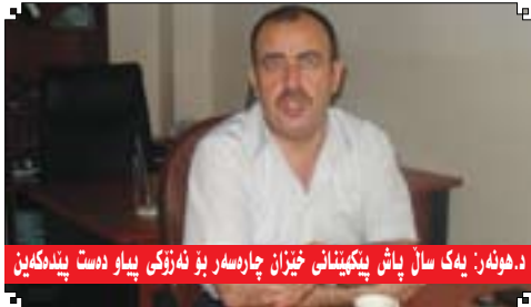
دههونه: یهک سال پاش پیکینانی خیزان چارهسهر بو نهزکی پیاو دست پندهکین