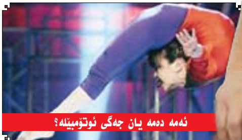
نهمه دهمه یان جهگی نوتومبینه؟