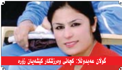
گولان عهبدوئلا: کچانی وهرزشکار کیشهیان زوره