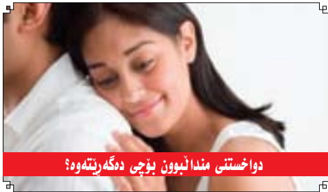
دواختنی مندالنبون بژی دهگهرنتهوه؟