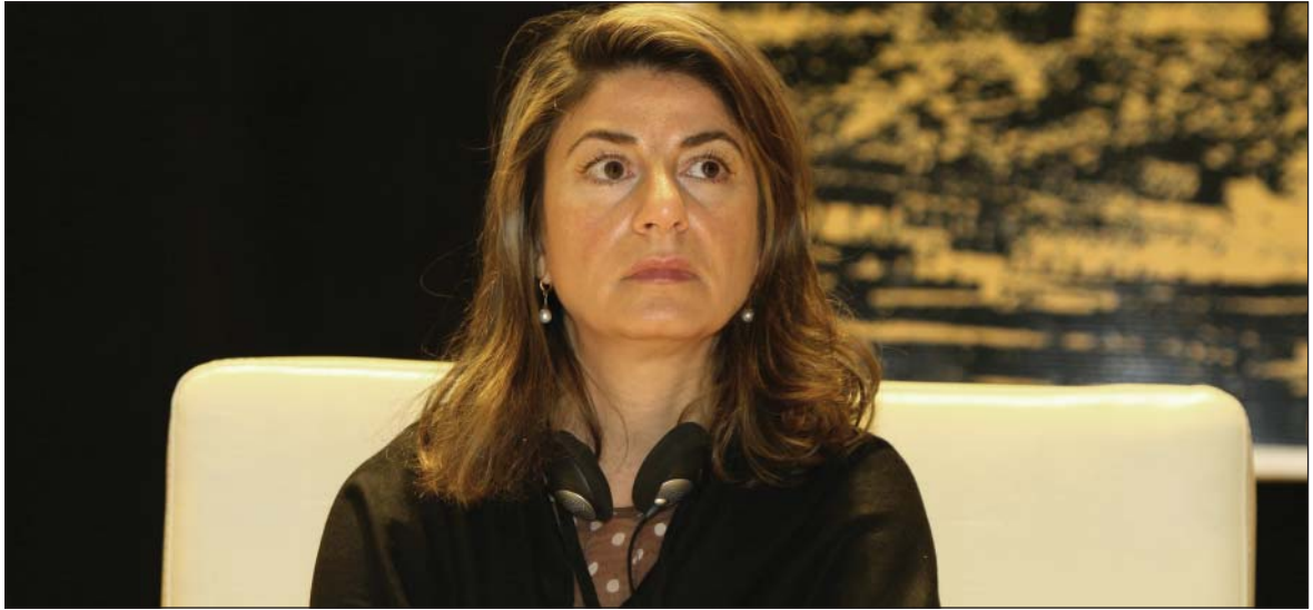
كاترين بومبيزگه، بەرپۆلەتەرى گشتى كۆمىيۇنى ئىئودەولەتى بۇ كەسە ونبووەكان (بۆسنە و ھەرزەگۇفېنيا):