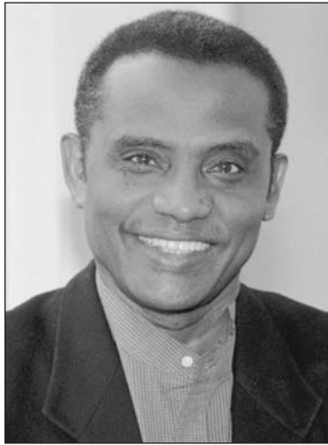
پروفیسور عەبدوللاھى ئەمەد تۆزەرى ئىسلامى بۆگولان

- ھەرۋەك پىشتەر نامازەم پىكرد دەپت بىر لەوہ بکەينەوہ چۆن رىگەبگىرن لەوہى پشتگىرى خەلك بەدەست بەھىن، من پىم وايە ئە گەر سەرکوتيان بکەين، ئەوا ۋەك قوربانى دەردەكەون و رەنگە ھاسۆزى خەلك بەدەست بەھىن، بەلام ئە گەر دەرەفەتيان پىدەين، بەشدارى مەلمانئ و رىكابەرىيەكە بکەن ئەو كاتە رووہرووى رەخنەدەبەنەوہ، ئەو كاتە سروشتى راستەقەينەيان دەردەكەوئت كە خاۋەنى شتىك نىن تا بىبەخشىن، كە خاۋەنى بەرنامە و سىياسەتتىكى ديارى كراۋ نىن.