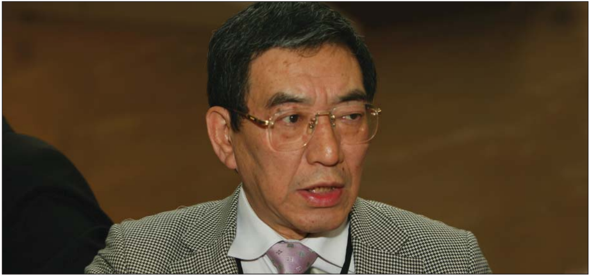
يۇشياكى ساساكيا راويژكار له دەرگاى ساساكاوا بۇ ناشتى له ژاپون: