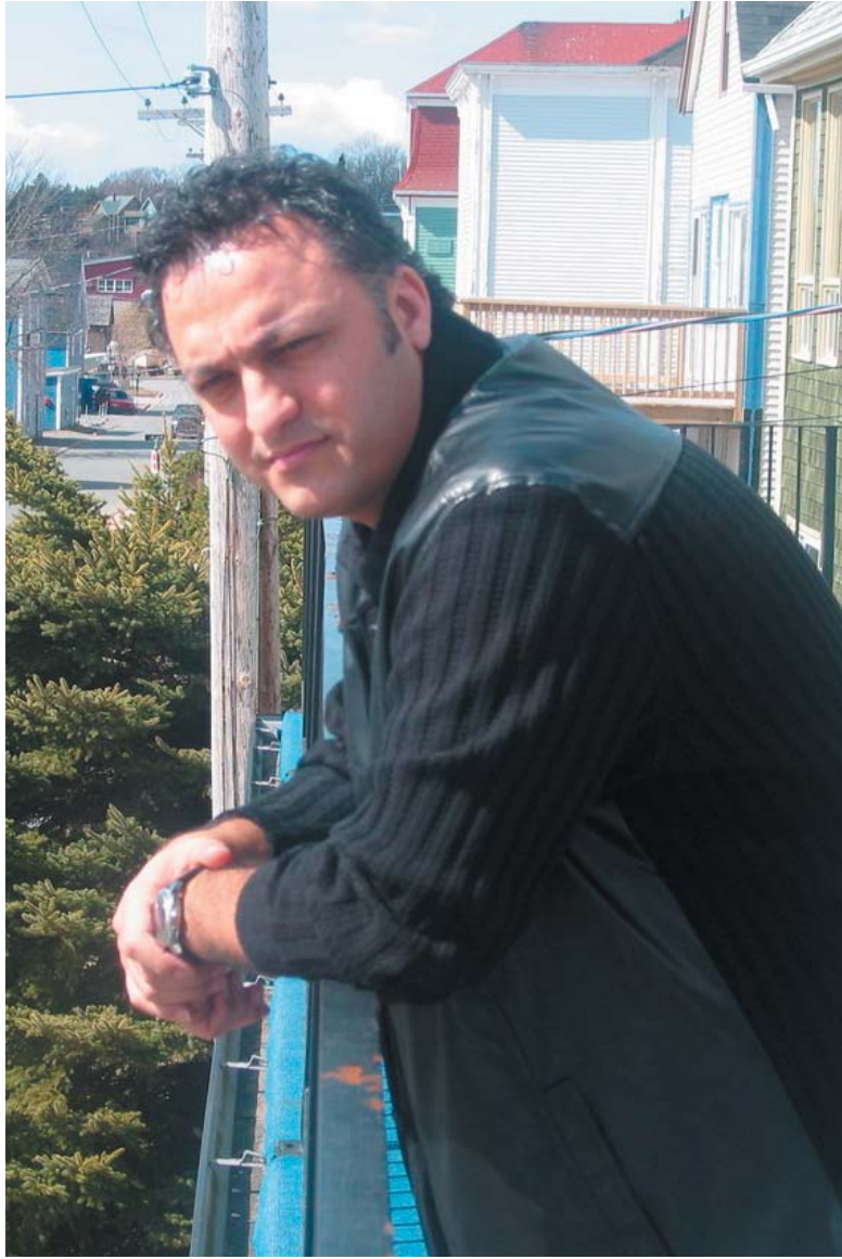
تۇنى كەيوان بۇ گولان:

- ۋەكو ھونەر جىاۋازىيەكى ئەۋتويان نىيە، چونكە ئەو كەسەي كارەكەي دەكات پىي دەلېن گۇرانىيىت ئەۋانەي پۇپ ۋ رۇك ۋ راپ ۋ جازىش دەلېن پىيان دەلېن گۇرانىيىت، بەلام شىۋازەكەي جىاۋازە ۋ گۇرانى مىللى ۋ فۇلكلۇرى ئەگۋرە تەنسا دەتوانىت گۇرانىيەكى بچوۋكى تىدا بكرىت