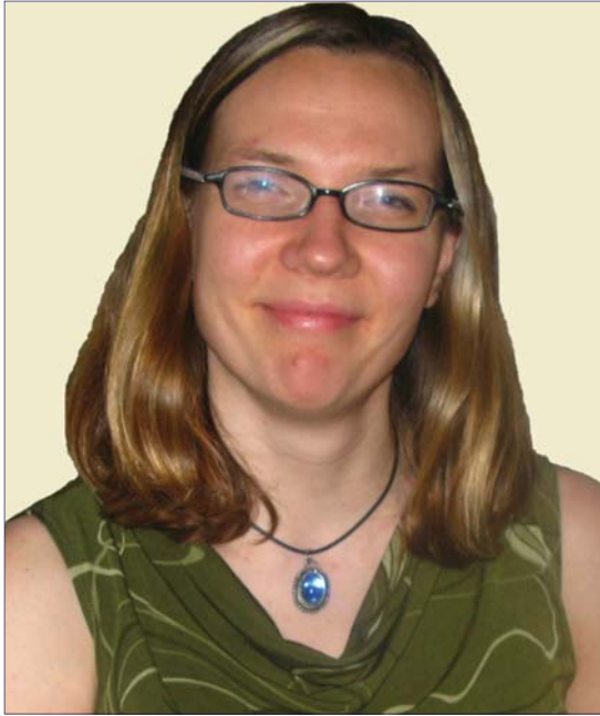
هیلی پالس بۇ گولان :