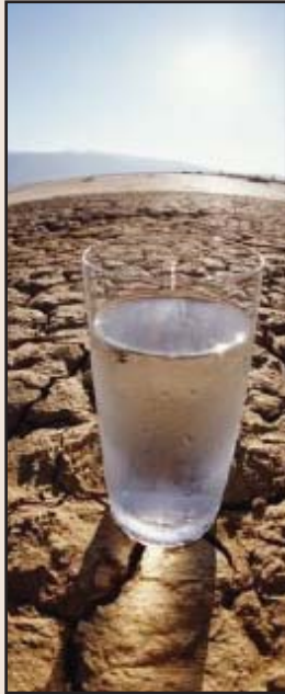
۶۰٪ی دانیشتوانی جیهان به‌هۆی که‌م ئاوییه‌وه‌ ده‌نالین