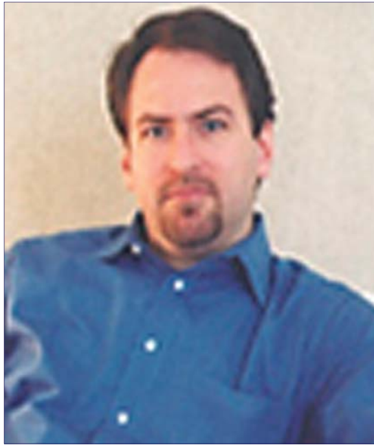
جیرارد ئەلسکەندەر بۆ گولان: