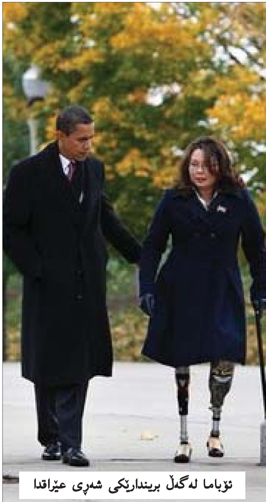
ئۆباما لە گەل برىندارىكى شەرى عىراقدا

من دەمەۋىت ئەۋەتان بە بىرپەينەۋە كە نايت لە ئالوگۆرى ئىدارەي ئەمەرىكا پىشېينى گۆرانكارى شۆرشگىرى بكەن لە شەۋ و رۆژىكدا، راستە ئۆباما بانگەشەي ئەۋەي كەردوۋە كە بە رەۋتىكى خىرا ھىزەكان دەكشېنیتەۋە لە عىراقدا، بەلام من دلنىام بە وردى لەم مەسەلەيە دەكۆلئەۋە پىش ئەۋەي برىارى لەسەر بەدات. ئەمە دەپىتە تاقىكردنەۋەيەكە بۆ ئۆباما، لەبەر ئەۋە دەپىت چاۋەرپى بكەين و ببىين.