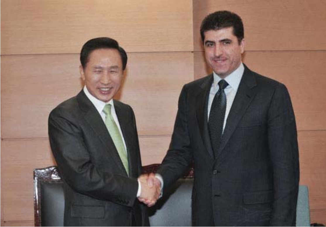
نیچیرفان بارزانی سەرۆک وەزیرانی حکومەتی ھەرێمی کوردستان لە گەڵ لی میۆنگ باک سەرۆک وەزیرانی کۆریای باشوور- سێئول

حکومەتەتە کەمانە». ھەر وەک بەرێزبان داواي لە حکومەتی ناوەندی کرد بۆ مەسەلە ی نەوت و سامانە سروشتییەکان پابەندی دەستوور بێت و گوتیشی: «ئەم ڕێککەوتنە نموونە یەکە کە دەبێ عێراق چی بکات، ئێمە باس لە پێداویستیەکانی گەلە کەمان دەکەین و دەبێ حکومەتی فیدرالیش ھەمان شت بکات، نەوت دیارییە کە بۆ ھەموو گەلانی عێراق. ئیستاش کاتی ئەوە ھاتووە ئەو دیارییە بۆ ھەموو گەلانی عێراق ڕەکاربخەین».