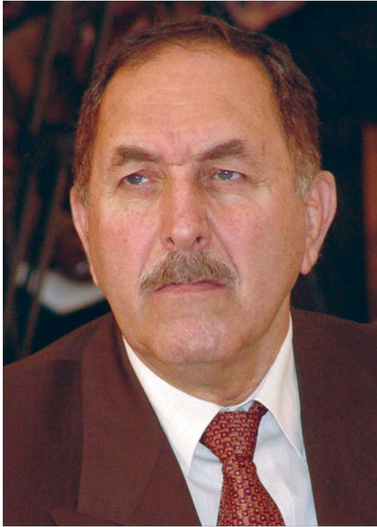
عارف تەيفور جىڭرى سەرۆكى پەرلەمانى عیراق بۇ گولان: