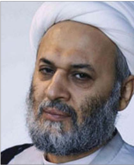
بەعسییهکان هەولیاندا بە یاسای پارێزگاکان پرۆسەي سیاسی عێراق بشیون

* پەرلەمانی عێراق دەنگی لەسەر یاسایەکاندا کە هاوپیەمانی کوردستانی لە گەلیدا نەبوو، ئەمە زەنگی مەترسییه لەسەر بنەمای تهوافوقی نیشتمانی کە لە دواي رووخانی رۆژی پێشوو هەموو لایەنەکان لەسەری رێککەوتوون. بۆچی لەم بربارەدا، هیژە عێراقیهکانی دیکە لە چوارچێوی ئەم تهوافوقە نیشتمانییه دەرچوون؟