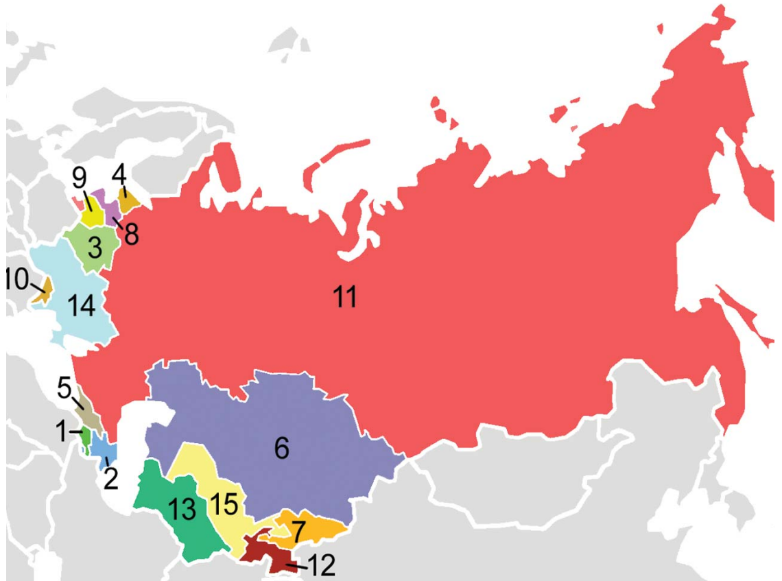
ھەلۋەشاندەنمەۋى يەككىتى سۇقۇت بۇ ۱۵ دەۋلەت