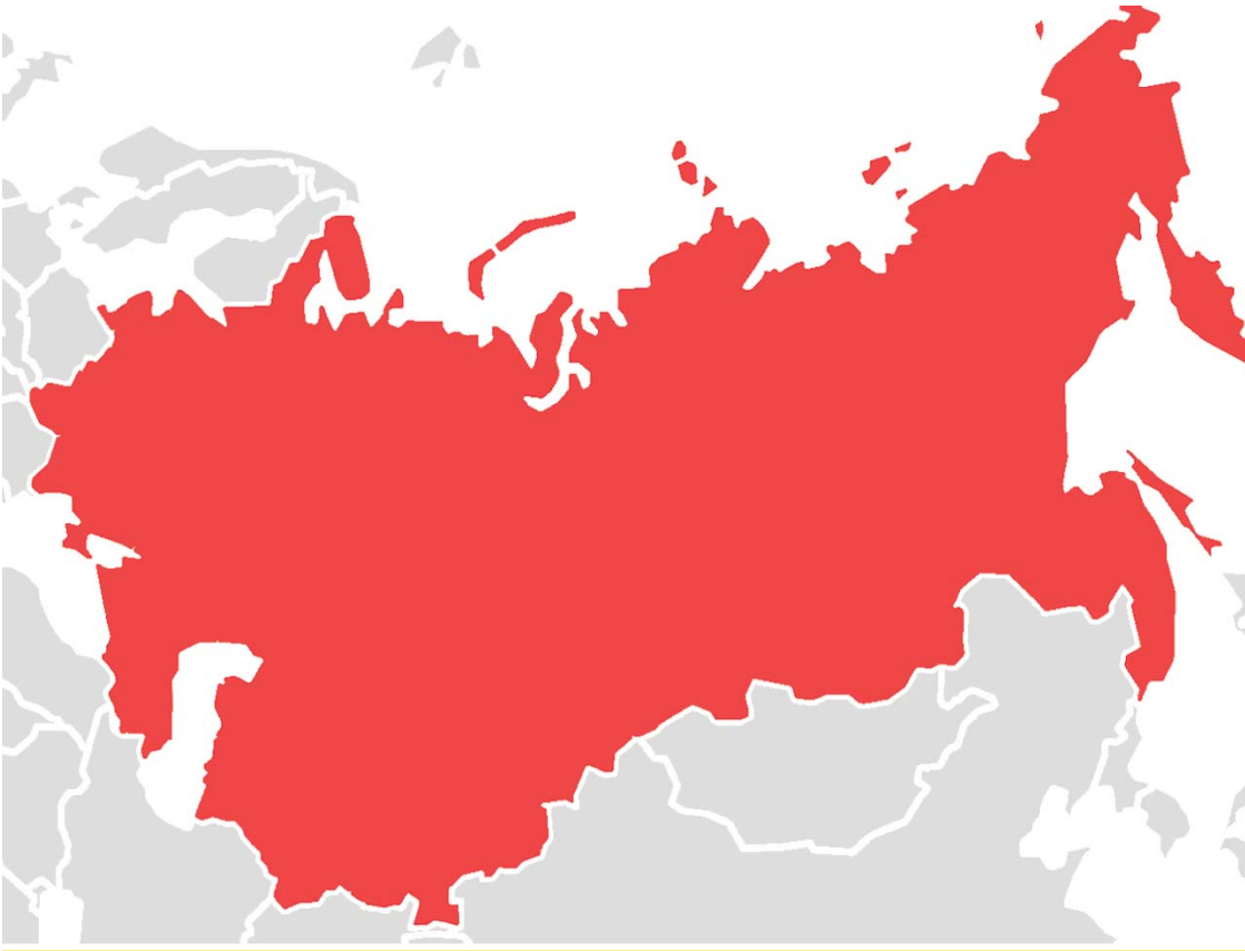
بەكیتى سۇقۇبتى پىشور