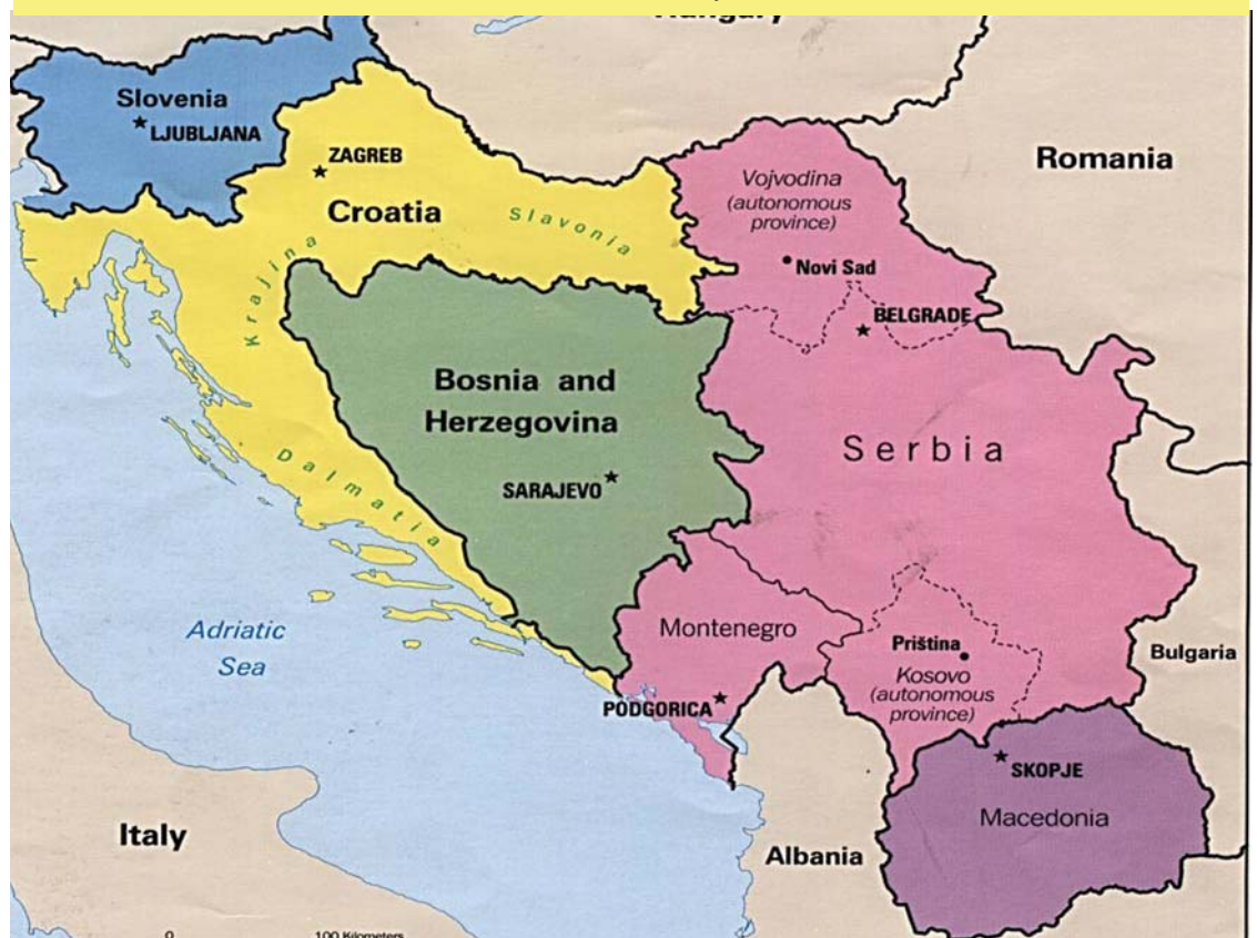
یوگسلافیا دواي دابهش بوون

●●● دابهشکردنی دەسەلاتەکان لە ناشنالی فیدرالیزمدا، دەسەلاتی فراوان دەداتە حکومەتی ناوەندی