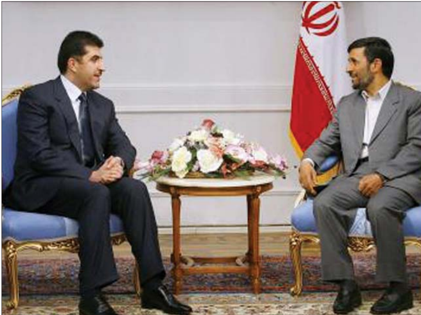
سەرکۆماری ئێران لە پێشوازی سەرۆکی حوکومەتی هەریکی کوردستان

۳- سەرۆک وەزیرانی تورکیا کاتیکی باردۆخی هەریکی کوردستان دەبێت، هەست دەکات لەم هەریکی پڕۆسەییکی دیموکراسی دەستی پیکردووە، راستە ئیستا ئەم پڕۆسەیی کامڵ نەبووە، بەلام هەنگاوەکانی راست و دروستن و بەرەو کامڵ بوون هەنگاوەگرت، پێویستە ئەم واقیعی تەواوی سیاسەتی ئەنقەرە بەرامبەر هەولێر بگۆریت، ئەمەش لەبەر ئەوەی کە میژووی دەولەتانی دیموکراسی پیمان دەلێت هەرگیز لەنیوان دوو دەولەتی یان دوو کیانی دیموکراتیدا شەر رووینەداووە و رووش نادات، یان دەبێت لایەکی لەو دوو دەولەتە یان ئەو دوو کیانە وازیان لە بنەماکانی دیموکراسی هینایت، بۆ تورکیا زۆر گرنگی پێش هەر دەولەتیکی دیکە ریز لەو پڕۆسە دیموکراسییەیی هەریکی کوردستان بگرت، لەبەر ئەوەی ریزگرتنی تورکیا