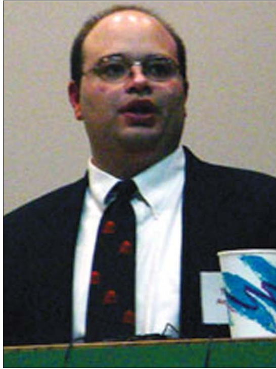
پروفیسور توماس ٹمبروسو پروفیسور لہ کیشہ نعتیہ کان و سیاسہ تی نیوڈوولہ تی لہ زانکوی نؤرس دا کوتا بو گولان: