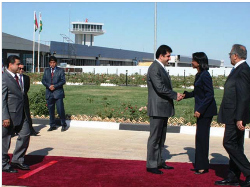
سەروكى ھۆكۈمەتى ھەرىمى كوردستان لە پىشۋازى كونداليزا راپس لە فرۇكەخانەى تىرەۋەلمتى ھەولپىر

چەند رۇژپكە گوپىستى ئەۋە دەبىن كە بەرپىز رەجەب تەيب ئەسەردوگانى سەروك ۋەزىرانى توركىيا سەردانى عىراق دەكات ۋە ھەر لەم سەردانەشيدا ئەۋجا لە بەغدا بىت يان لە ھەولپىر لەگەل سەروكى ھەرىمى كوردستان ۋە سەروك ۋەزىرانى ھۆكۈمەتى ھەرىمى كوردستان كۇدەبىتتەۋە، ئەم ھەۋالە لەسەر ئاستى ھەرىمى كوردستان ۋەك ھەۋالىكى باش (Good News) پىشۋازى لىدەكرپت ۋە زۇربەى چاۋدپرانىش پىپانوايە تەنھا بە دەستپىكردى