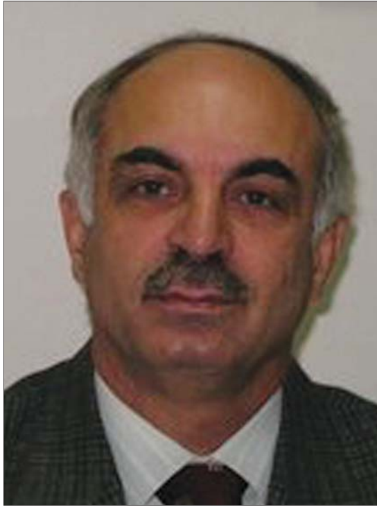
پروفیسور محمەد نورەدین پسپۆر لەسەر دۆسیی تورکیا و کورد لە لوبنان بۆ گولان: