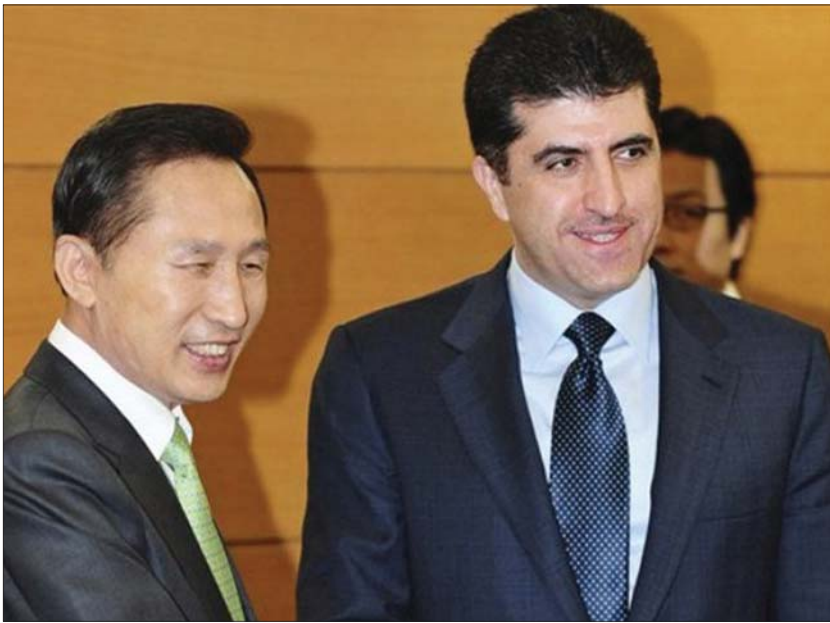
سەرۆکى کۆريای باشوور لە پىشوازی سەرۆکى حکومەتى ھەرئىمى کوردستان

تورکيا لە لکاندەوئەى کەرکوک بە حکومەتى بەغداوئە بەرژەوئەندىبەى کەرورەى ئابوورى دەکەوئیتە خانەى گومان و دتەراوکیى سیاسى، بەلام بەگەرانەوئەى کەرکوک بۆ سەرھەرئىمى کوردستان تورکيا بەرژەوئەندىبەى کەرورەى ئابوورى مسۆگەر دەبيت