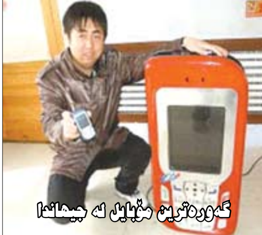
گەۋرەتتەن مۇبايىل لە جىھاندا

گەۋرەتتەن مۇبايىل لە جىھاندا لە ژىر دەستى ئەندازىبارىڭكى چىنى بەناۋى (تان)ۋە درووست كرا، بېرۈكەيەكى سەيرى ئەم گەنجە تەمەن ۲۴ سالەيە و لە شارى (سۇنگ يانگ) دەژىتت لە ۋلاتى چىن. مۇبايىلەكە دەبىتت بە باۋشت ھەلىبگىتت بۇ ئەۋەي بىگۋايتەۋە، درېژىيەكەي (۱) مەترىك دەبىتت، ھەرۋەھا كىشەكەشى (۷) كىلوگرامە. ۋەكو ھەر مۇبايىلېكى ئاسايى كار دەكات و گىشت سىفاتىڭكى مۇبايىلى تىدايە. ھەنگاۋى ئەم گەنجە ئەۋە بسو بتوانىت مۇبايىلى لەم قەبارەيە گەۋرەتر درووست بىكات، بەلام ھىچ جۆرە پاتىرىيەك نىيە تاۋەكو كار بە مۇبايىلەكە بىكات. ۋەكو لە ۋئەكەدا دەبىنن مۇبايىلەكە لە شىۋەي مۇبايىلى (غازى ياور)ە، و گەۋرەتتەن مۇبايىلە لە جىھاندا.