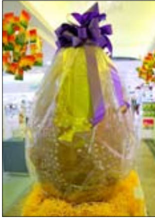
■ نه مه گه وره ترين هيلكه په له جيهاندا