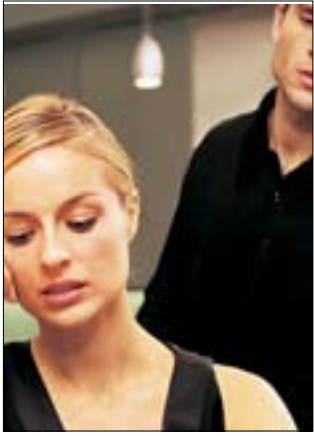
■ نيسټيفلاكردنئ نافرته له داموده زگاؤ شوئني كار كردندا

■ سهرونوسهر فؤاد سديق Editor-in-Chief Fuad Sideeq fuadsdeeq@yahoo.com تله فون: ۰۶۶ ۲۲۳۲۳۸۵ مؤبائل: ۰۷۵۰۴۴۵۲۳۵۸