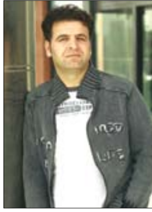
■ هونه رهنه نه رده لان به كر: تا بازرگاني به هونه نه كرئت پيش ناكه وئت

■ آيگرئ سهرونوسهر فهرههه محهمهه Deputy Editor-in-Chief Farhad M.hassn frhd_mhmd@yahoo.co.uk Farhadmohmad@gulan_media.com تله فون: ۲۲۳۱۵۲۷