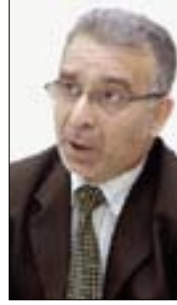
رهزا آهواد تهقى

■ آهوان ئيمتياز شهوكهت شينج يه زدين Concessioner Shewket Sh. Yezdeen