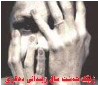
ژینگ هەشت سال زیندانی دەکری