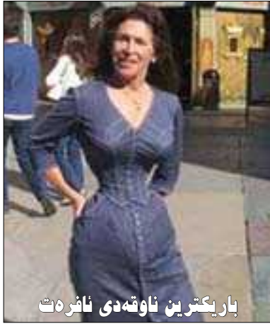
باریکترین ناوڤه دی نافرەت