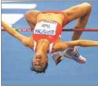
سۆبۆلیشا ریکۆردیکسی نوێ تۆمار دەکات

■ سەر نووسەر فواد سەدیق Editor-in-Chief Fuad Sideeq fuadsdeeq@yahoo.com تەلەفون: ۰۶۶ ۲۲۳۲۳۸۵ مۆبایل: ۰۷۵۰ ۴۴۵۲۳۵۸