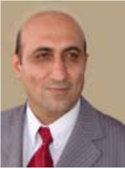
نازا ھەسیب قەرداغی

حەقیقەتتە ئیكی دەستووری لە عێراقدا بە كۆلە گەمی سیاسی و یاسایی و ئابووری و دامەزراوە سەرۆهییەکانی پایەدارە و، نەتەوە یەكگرتوووەکان و ئەمەریكا و ئەوروپا و ولاتانی جیهان دانیان پێداناوە و مامەڵەیی جۆراوجۆری لەتەكدا دەكەن.