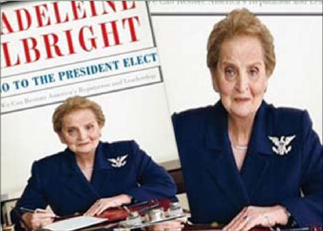
خانم ئۆلبرايت لە كىتپە تازەكەيدا پىشنىار دەكات دولەتى عىراق بۆ سەر سى ھەرىمى فیدرالى داھەش بىكرىت