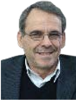
ناسۆ که ریم