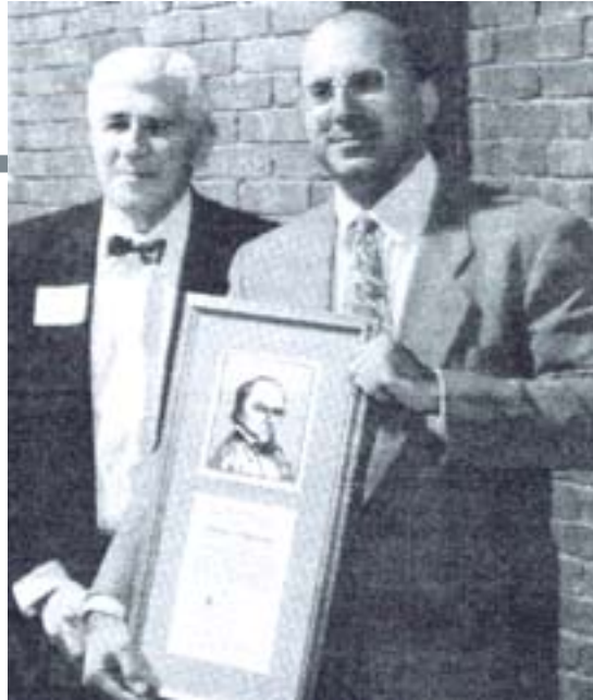
پروڤيسور فليپس جامس خلاتي باشتين پارٽيزي لاسر ناسي شمريڪا وروگرت

■ پروڤيسور فليپس جامس والگهر ڪه دبلوماتيڪي نميريڪيهو يڪيڪه لهو دبلوماتڪارانهي ڪاري له عيترافيدا ڪردووي راولپنڊي ڪاري ياساوي دهسه لاته ڪاتي هاوپهيمانان بسوه له عيتراف له دواي سالي ٢٠٠٣، هروها وهڪ پسنچريڪ به شداربروه له