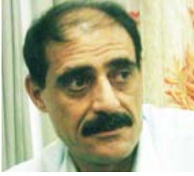
کەرکووک کوردستانیکی بجووک