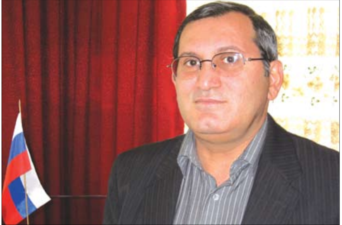
فاگيف گريف، كونسولتي گشتي رووسياي فيدراي لههوليرى پايتخت: