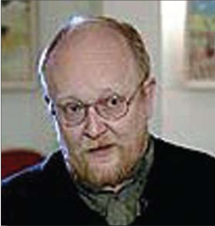
ئەلىكس مالمەشىنكوف سۆيۈنۈگ و پىپورى ئاسايشى نىۋدەولەتى:

■ ئەلىكس مالمەشىنكوف، كۆمەلئاس و پىپورى بواری ئاسايشى نىۋدەولەتى لەناۋەندى ستراتىيى (Foua Carnegie) لەمۆسكۆ كاردەكات. مالمەشىنكۆ سەرنجى كىشاپە سەر كىشەى كورد و گوتى: "ئەو كاتەى باسى كىشەى كورد دەكرى، ۱۰ نارنجۇكى هايدروچىنى دىتە خەيالم". مالمەشىنكوف تىشكى خستە سەر پەيوەندى نىۋان ئەمريكا و روسيا كە پىپوایە پەيوەندى نىۋان ھەردوو ولات بەرەو گرژى و ئالۋزى زياتر دەچى. ھەروھا ئەھمەدى ئەژادى سەركۆمارى ئىزانىشى بەكەسىكى نادروست و نەگونجاو نازدەكرد. ■