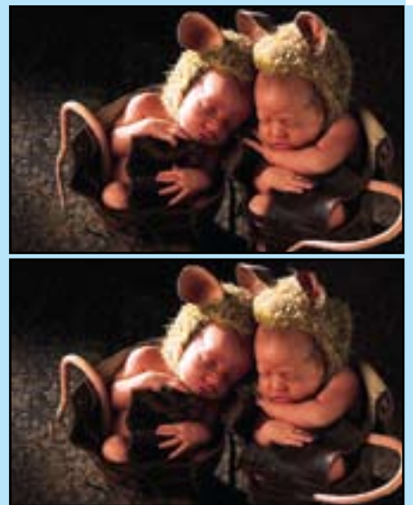
ئايا دەتۋانى لەماۋى چەند خولەكىكىدا جىاۋازبەكان بدۇزئەۋە