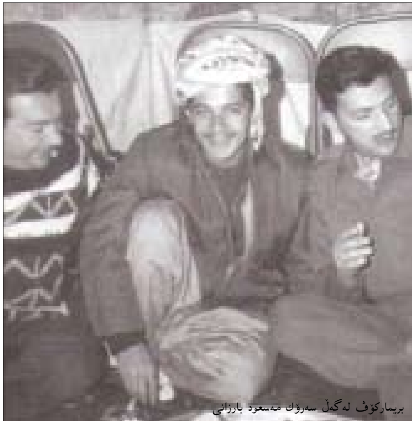
بريماركوف له گهڻ سهروك مه سعود بارزانی

بريماركوف و هاوييره كانى له و باوه دهان كه كورده كان له عىراق گه وره ترين هئزى سياسى يه كه خستون و ههردوو پارتته كه له وه شدا يهك دهنگن كه ده بى كؤنترؤلى ناوچه دابراهانى كوردستان كه ركوك و موسل و گهرانه ويان بؤ سهر ههريئى كوردستان و ههولئ گهرانه وهى كورده دهر كراهه كان بؤ سهر جيو زئدى خوئان بدرئت و ههردو ولايهن (تاله بانى و بارزانى) گه لئك جار رايانگه ياندوه كه هپچ كاتئك ئه وان ده سته به ردارى كه ركوك و ناوچه دابراهه كان نابن له بهر ئه وه وهك و ترا كه ركوك نه ته نيا ناوه ندى سياسى و كولتورى كورديه به لكو گرنگيه كه شى له وه دايه كه له بارى نه وته وه دووهه م شوئنه له عىراق و زاپاسى نه وته كهى به ده مليارد به رميل به راورد ده كرئت.