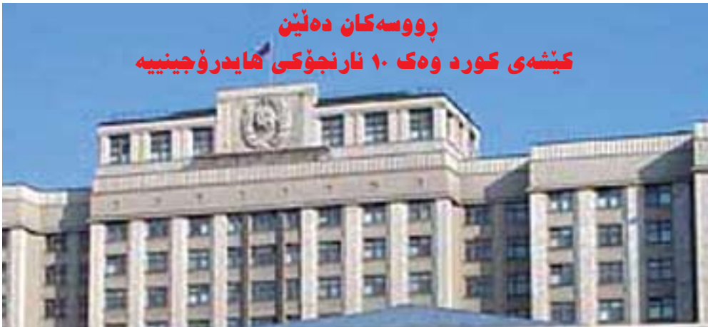
رووسه‌کان ده‌ئین کیشی کورد وه‌ک ۱۰ نارنجۆکی هایدرو جینییه