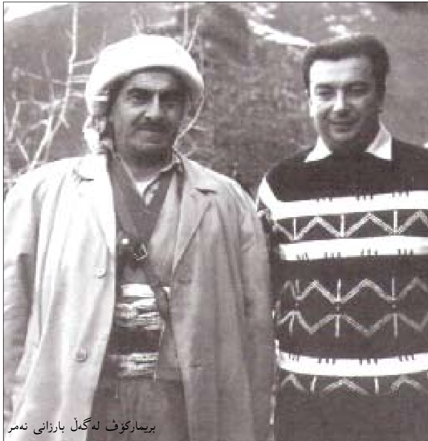
بريماركوف له گهڻ بارزانی نهمر

دهيٽه بههٽر بونى ههولئ كورد هكان كه بانگه وازى ئوتونوميه كه بيان بؤ دهوله تىكى سهر به خو بكن. به شىك له به شدارانى نهم لىكولئنه وه پيسان وايه كه ههره شهى ناردنى سوپاى توركييا بؤ باكوورى عىراق حه تمبيه (ئه گهر توركييا پى وايٽ نه وه مؤديلهى كه بؤ چاره سهرى كيشهى كورد پيشنيار دهكات جىنى په سهند نه يٽ). توركييا بهم ههنگاه توندهى خوئى له وانديه به سهروهى ولاته كهى خوئى بخاته مه ترسييه وه كه ژماره يه كسى زؤر له دانيشتوانى ولاته كهى خوئى كوردن، بههٽر بونى جيگه و پىگهى كورده كانى عىراق دهيٽه هؤى چالاکتر بونى توركيياش ههروهه فاكتهرى نه وتيش دهورئكى زؤرى بؤ توركييا ده يٽ.