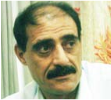
کهر کووک کوردستانیکی بجووک