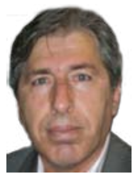
مجمعه شفيق ئونجو- ئەلمانيا