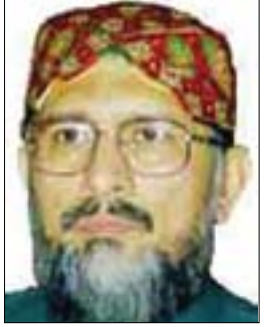
پروفسور سعید مینا جولحه‌سن

ب- ته‌م باره ئالۆزه بووه زه‌مینه‌یه‌کی له‌بار بؤ گروپه تیرورېستییه‌کانی ناو پاکستان و ته‌وانه‌شی له سنووره‌کانه‌وه دپنه‌ ناو