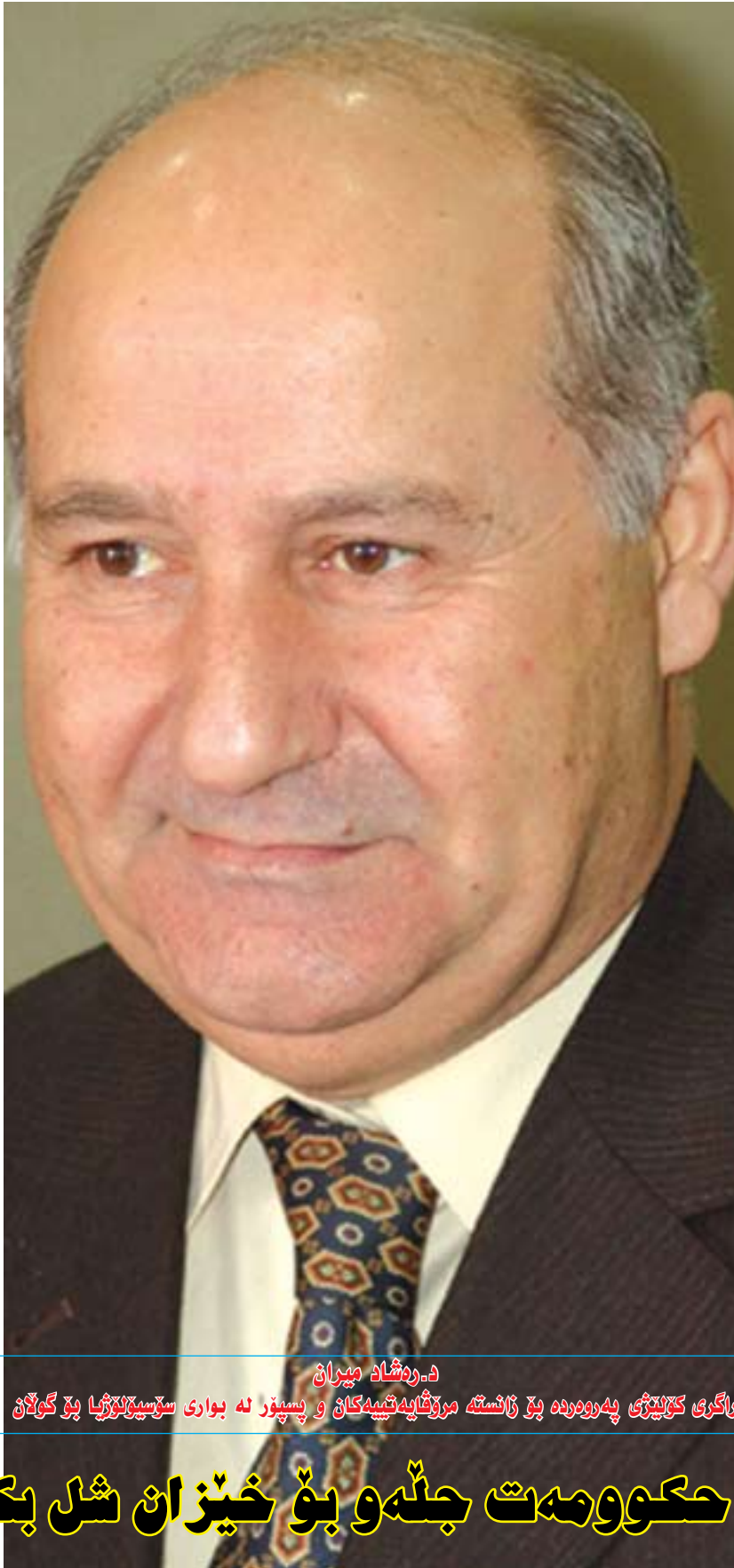
د.رەشاد ميران راگري كۆلچى پەرورەدە بۆ زانستە مەشائىيەتچىلەر ۋە پىسپۇر نە بواری سۆسپولونۇرۇيا بۆ گولان