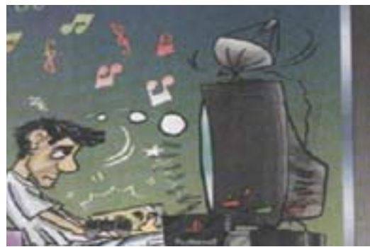
نایا دەوانیئت لە ماوهى چەند خولەكێكدا جیاوازیبەكان بەدۆزیتەوه.