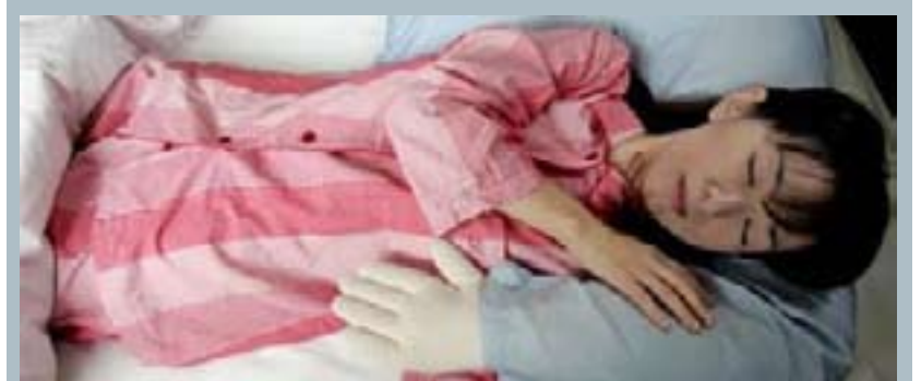
ئەوھش بووہ پالڤ؟

لە شارى (دېژىبىگل) لەولائى ئەلمانىا شوفىرەكى سەرخۆش لە درەنگانىكى شەودا خۆى بەمانىكدا دەدات و سەپرتىن رووداوى ھاتوچۆ ئەنجام دەدات، رووداۋەكەش بەم شۆبەى دەبیت: دواى ئەوھى خىزا دەبیت و ناگادارى خۆى ناپىت بەرەو خانوويك دەروات كە لە دار دروست كراوہ و ناتوانىت كۆنترۆلى ئۆتۆمبىلەكەى بىكات راستەوخۆ دەچىتە ناو خانووكە و نپوھى ئۆتۆمبىلەكە دەچىتە ناو خانووەكە. لەگەل رووداۋەكە