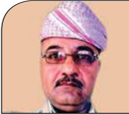
شىنگال ھەرىمى و بەغدا كوم دكەت