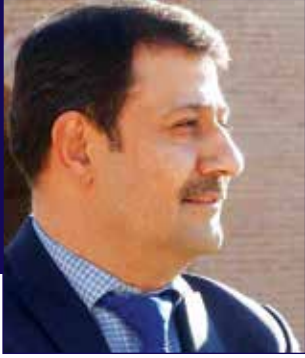
فهرهنگ غه فور