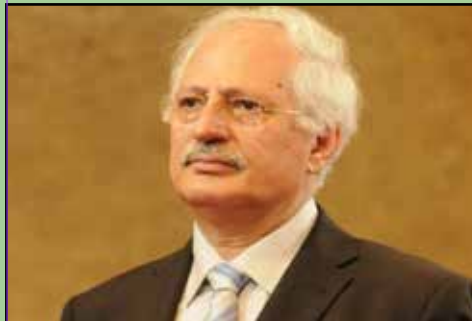
دكتور موزير فهزل

شارهزای دستورو راویژکاری یاسای نپودهولتی ماموستای بهشار له یاسای مدهنی تندامی هملپژدرای لیژنه نویسنهوی دستور