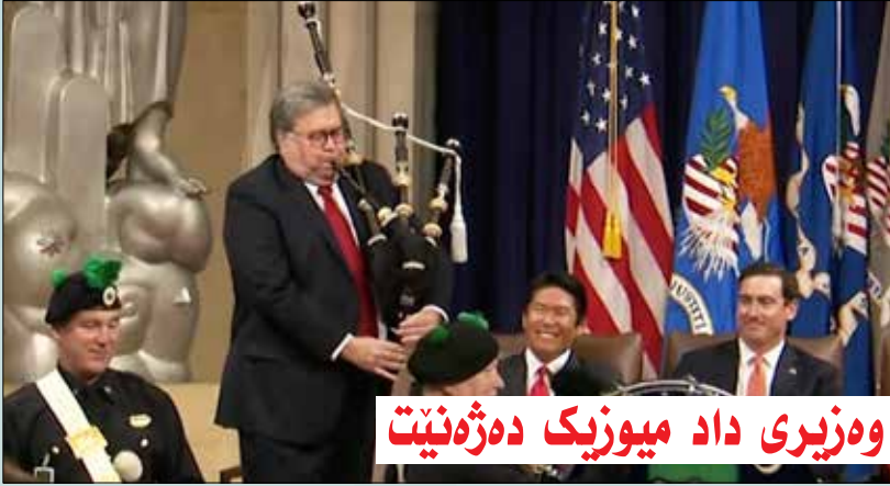
ۋەزىرى داد مېوزىك دەژەنىت

سادىيى و ساكارىي كاربەدەستان و كەسايەتتېبە ناۋدارەكانى جېهان، دەبنە ھەۋال و قسە و باسى خەلك، ۋەك ئەۋەدى ۋەزىرى دادى ئەمىرىكى لە كۆنگرەي نىشتىمانىي پارىژەران ئەنجامى دا و بوۋە جىيى دلخۇشى و سەرنجى ھەموۋان، ۋەزىرى دادى ئىستىئاي وىلايەتە يەكگرتوۋەكانى ئەمىرىكا (ۋىليام بار) جگە لەۋەدى كەسىكى جددى و فەرمىيە، بەلام لە بۇنە و يادەكاندا كارى تازە و ناۋازە ئەنجام دەدات، بەر لە پىشكەشكردىنى ۋتەكەي لە كۆنگرەي پارىژەران كە لە شارى واشنتونى ئەمىرىكا بەرپۇئەچوۋ، لەۋ كاتە تىپى مېوزىكى كۆنگرەكە نىمايشىكى مېوزىكى پىشكەش كرد، ھەر لەۋكاتە جەنايى ۋەزىرىش نامىرى مېوزىكى (قەربە - the bagpipes) لە يەكىنك لە ئەندامانى تىپى مېوزىك ۋەرگرت و بەشدارىي كۆرسى نىمايشە مېوزىكەكەي كرد، بە شىۋازىكى زۇر جوانىش لە گەل ئاۋاز و رىتمى نىمايشەكە دەپۇشت.