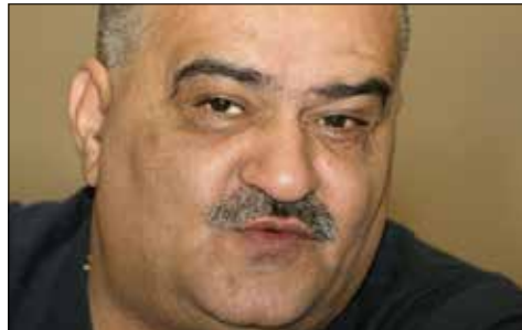
د. نه ژدهت ئاکرهیی پسپۆر له ئاسایشی نه ته وهیی