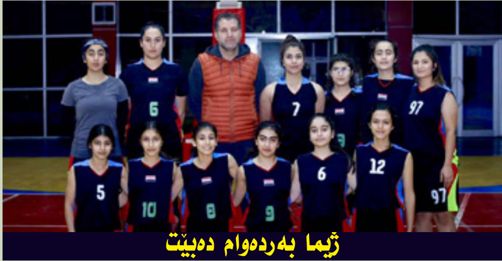
ژيما بهردهوام دهبيت

ژماره‌ی کچه ياريزانه‌کانی ژيما بگاته ۲۰۰ ياريزان، له مانگی تهمموزی ئەمسالی ش واپرياره له شاری سلیمانی پالەوانی تیبی رۇژئاوای ناسیا بۇ ناستی سهرووی تهمن ۱۶ سال بهرپوه بچیت».