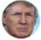
Donald J. Trump @realDonaldTrump

«ئەگەر دواي كشانەوہى ھىزەكانمان لە سووریا، توركيا ھىرش بكاتە سەر كوردەكان، ئەوا ئابووربىيەكەى دەخكێنن، بەلام نابیت كوردەكانىش ئىستقزای توركيا بكەن.»