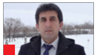
سەنعان تاتكى: پىۋىست بوو ۹۰٪ خەلىكى كوردستان دەنگيان بە پارتى بىدا، بۇ ئەۋەى پارتى بەتەنيا تواناى دارشتن و دانانى دەستور و ياساى ھەبوۋايە

كوردستان بەھىزى بىت، گەنجان ۋەك ھەمىشە لە ھەموو ھەلومەرجىكدا سەرکەوتتو دەبن، ۋەكو بارزانى نەمر فەرموۋىەتى گەنجان سەرى رەمن. لە خولى پىنجەمى پەرلەمانى كوردستانىدا دىنباين پارتى كار بۇ نەھىشتىنى بىكارى و رەخساندىنى ھەلى كار بۇ گەنجان دەكات».