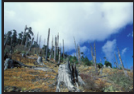
كارىگەرى پىسبونى ژىنگە لەسەر مرۆف

ئەم مەزىندە نوۋىيە، لە مانگى جولاي ئەمسالدا بلاۋكراۋتەۋە و تىيدا باس لەۋە دەكاتە پىسبونى ھەوا بەرپرسيارە لە ۱۴/۱۴ نى حالەتە نوۋىيەكانى شەكرە لە جىھاندا. ھۆكارەكانى دىكەش ۋەكو بۇماۋىيى، كىشى زۇر، خۇراك و ئاستى چالاكىيە جەستەيەكان كارىگەرپىيان لەسەر مەترسىيە توشبون بەم نەخۇشىيە ھەيە، ئەمەش لە جىھاندا لە تەشەنە كوردنايە. رىكخراۋى تەندروستى جىھانى، مەزىندە دەكات زياتر لە ۴۲۲ مىليۇن خەلك ئىستا لەگەل شەكرەى پلە ۲ - دەژىن لە كاتىكدا لە سالى ۱۹۸۰ ژمارەكە ۱۰۸ مىليۇن بوو. رىژەى توشبون لە جىھاندا ۋەك يەك نىيە، ولاتانى ۋەك چىن و پاكستان و ھىندستان پىسبونى ھەوا تىياندا بەرزە، حالەتەكانى توشبون بە شەكرە و مردن بەھۇى پىسپى ھەوا و ژىنگەش سالانە ژمارەيەكى زۇر لە خەلكى دەكوژىت. لەگەل ئەۋەى ويلايەتە بەكگرتوۋەكانى ئەمريكى ئىستا تا رادىيەك ھەواى پاكە، بەلام لە لىستى ولاتە بەرزەكانە لە توشبون بە نەخۇشىيەكانى شەكرە و دل.