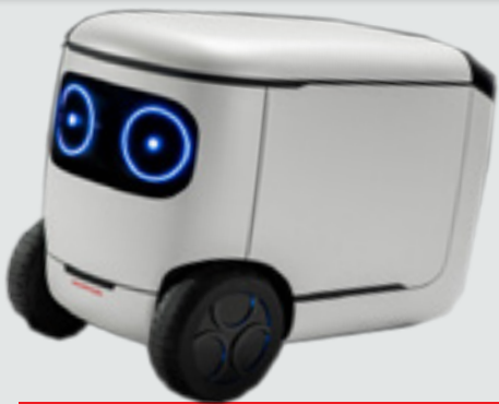
رۇبوتى جۆرى E3-C18:

لە پيشانگاي سالانەى CES 2018 دا كۆمپانىيەى ھۇنداي ژاپونى، يەككىك بوو لە پىشەنگانى پيشانگا. چەند سالىكە كۆمپانىيەى ناوبراۋ تەنىيا ئەركى خۇى بە بەرھەمەننىانى ئۆتۆمبىل تەرخان نەكرىدوۋە، ھەرچەندە بەيەككىك لە كۆمپانىيا بەھىزەكانى بوارى بەرھەمەننىانى ئۆتۆمبىل ناسراۋە.. كۆمپانىيەى ناوبراۋ نىيازى