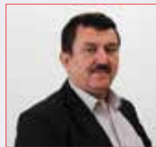
حه سه ن جاف - نه مریکا:

دهنگی (به لێ) واته سهریهخۆیی و دهولهتی کوردستان، ولاتیکی مهزن به دهست دههینن، بۆ سهرکهوتنی ژیاپیهی خۆمان، دهنگی به لێ فاکتهرێکه بۆ سهقامگیر و ناوهدانی، له میژووی نهتهوهی کوردا که سهدان ساله خێرمان له خۆ نه دیوه، له پاش نهوه (به لێ) یه تامی ئازادی و سهریهستی و مهردایهتی خۆمان دههۆزیهوه، وهکو گهنجیک شانازی به کورد بوونی خۆم دهکهن، داواکاریشم هه موو گه نجان و خه لکی کوردستان کار بۆ سهریهخۆیی و دهولهتی کورد بکهن، تا وهک هه موو گهنجی جیهان له خۆشگوزه رانی و نارامی بژین، چونکه سهریهخۆیی مافی رهوای گه لی کورده، نهوه نه گه ره دهمانه ویت ریز له خۆینی شههیدان بگه رین، با خاوهن دهولهت و سهریهخۆیی خۆمان بین، چونکه ته نیا به م ریگه یه زامی کهس و کاری شههیدان و نه نفال پره وینینه وه، ولاتی خۆمان شوناس و ناساندنی خۆمانه و پێویستمان به دهولهتی که تا به خۆشی و ئازادی بژین.