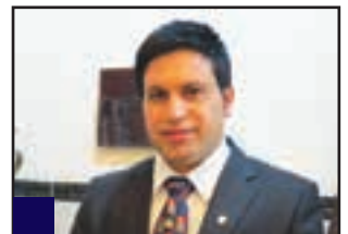
ھالان ھورمز گۆرگىس :

زۆرىيە ھەرە زۆرى پىنكھاتەكانى موسىل ۋە دەشتى نەينەوا ھەز دەكەن سەرىيە ھۆكۈمەتى ھەرىمى كوردستان بىن، چۈنكى رايانوايە ژيان لەگەن غەرب زۆر سەخت بوو ۋە ناتوان پىنكەو ېژىن