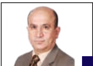
نەوزاد پۇلس ھەنا :

ئىمە بەشىكىن لە خەلكى كوردستان و چارەنووسى ئىمەش لەگەن چارەنووسى خەلكى كوردستاندايە و لە مېژووى رابردووش ھەر چارەنووسمان پىكەوہ بووہ و بە ناشتەوايى پىكەوہ ژباوين