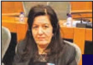
وھىدە ياقۇ ھورمز :

ئىمە بەشىكىن لە خەلكى كوردستان و چارەنووسى ئىمەش لەگەن چارەنووسى خەلكى كوردستاندايە و لە مېژووى رابردووش ھەر چارەنووسمان پىكەوہ بووہ و بە ناشتەوايى پىكەوہ ژباوين