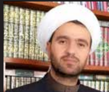
تايبەت بۇ گولانى نووسىيۇە

مِنْ حَرَجِ) سۈرە الحج/۸۷. مافى چارەى خۇنوسىنى گەلى گوردو سەربەخۇبى دەچىتە خانەى كارناسانى و جۇرى يارمەتى بۇ خەلك، ئەمەشيان بنەمايەكە لە بنەماكانى شەرىعەتى ئىسلام. سۈرەنەھى ناسنامەو ھەلۈەشانەنەھى دەۋلەت بە ھىچ شىۋەيەك لە بەرنامەى ئىسلامدا نىبە، چونكە ئەو ھەزرىتى (رسول اللہ صلى اللہ عليه وسلم) فەرموۋىتەتى ھەموو نەتەو ھەلۈەتەكان لە خزمەتى دەۋلەتدا دەبن (عەرب+كورد+فارس+پەرس+ھەبەشى و.. ھتد) و ھەرگىز نەيفەرموۋە بە حوكمى بووتتان بە ئىسلام ناسنامەكانتان بگۇرن، بۇ ھەر شوئىكىش كەسك دانراۋە بۇ جىبەجىكردنى برىارو راسپاردەكانى ئىسلام، كەواتە ھىچ بەرەستىك نىبە لە روانگەى ئايىن و دىدى زانايانى بواری فىقە و شەرع بۇ دروستكردنى دەۋلەتتىكى نوى و تازە بۇ ھەر نەتەو ھەبەك، چونكە ئەمە دەبىتە پالېستىكى بەھىز بۇ ئىسلام لە جىھان، ھاۋكىشەكانىش لە بەرزەۋەندىي مۇسلمانان دەبن و بە ھەيمەن و نفوسى زياتر ھەبەتتى ئىسلام ۋەكو خۇى نىشان دەدات. بۇيە پىۋىستە ھەموومان بە تىكپراى چىن و توئۇزەكان كىشەكانى (سىياسى، حزبى) ۋەلا بىنن و بە يەك دەنگ بەرەۋپىرى ئەم دەرفەتە زىرپىنە بچىن و بە دەنگى (بەلۇ بۇ سەربەخۇبى كوردستان) بەرھەمى خەبات و تىكۇشانى چەندەھا سالەى ئەم نەتەو خىر لە خۇ نەدىۋە دەست بخەين. چونكە ئەمە ئەركىكى ئايىنى و نىشتمانىيە.