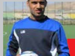
هەندەریڤن عدلی یاریزانی یانە هەندەریڤن:

وەکو پالەوانێک دەنگ دەدم بە بەلجی بۆ سەرەخۆیی کوردستان، لەبەر ئەوەی ئێمە کورد ئەو هەموو ساڵە ئێش و نازار دەکێشین بۆ ئەوەی ئێمەش وەکو هەموو ولاتانی جیهان سەرەخۆ بیین و خاک و ئالای پاسەپۆرت و رەگەزنامەیی تاییبەت بە خۆمان هەیە، دوور بین لە دەستی رژێمی داگیرکەر کە ئێستا و ئێستاش کۆمەڵێکی شۆقینی حوکمی عێراق دەکەن. داواکارم لە گەشت وەرزەشکاران دەنگ بە بەلجی بەدین بۆ سەرەخۆیی کوردستان بۆ ئەوەی لە پالەوانییهتییهکان بە ناری کوردستان و ئالای خۆمان بەشداری بین و سەرەخۆ بیین، بە هەر دە پەنجە دەستم و آزرۆی دەکەم و دەلێم: بەلجی بۆ ریفرااندۆمی سەرەخۆیی کوردستان.